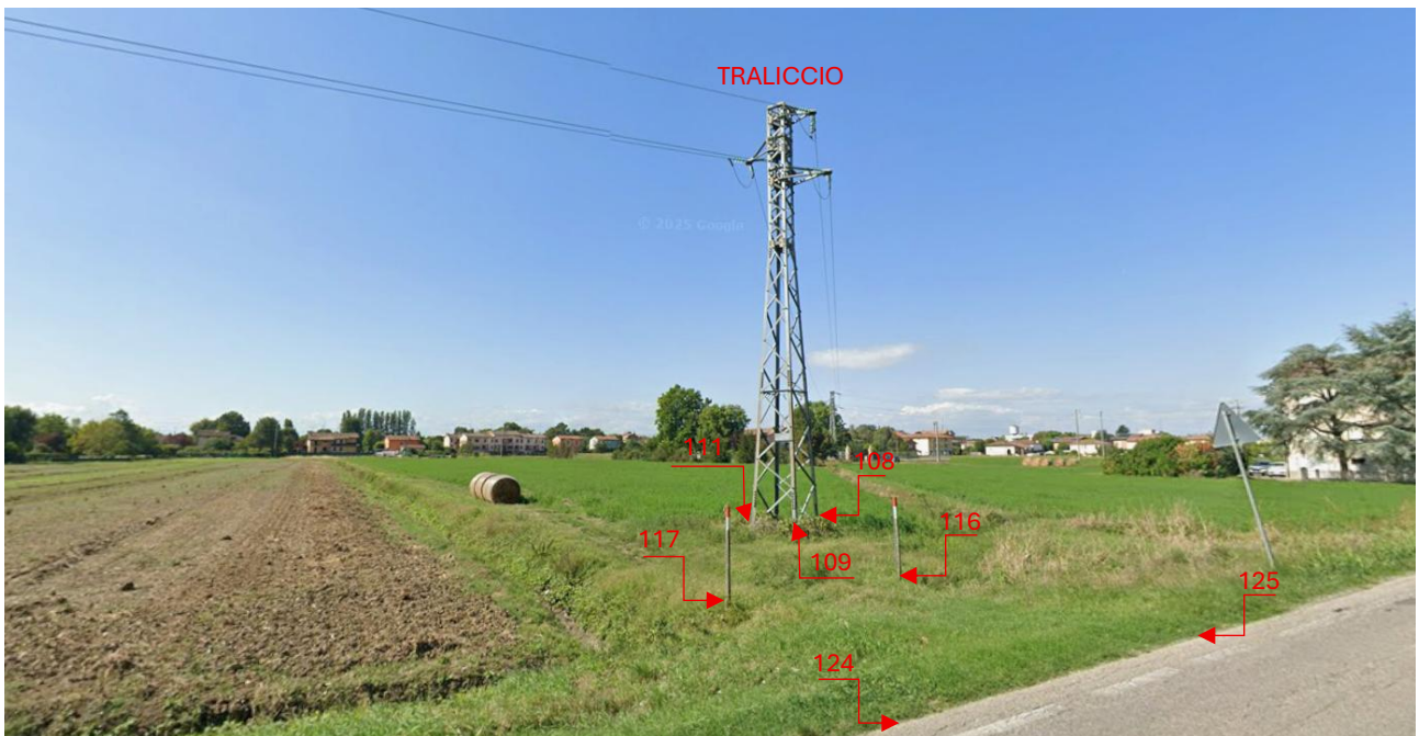
Figura 3: Fotografia con posizione punti di rilievo