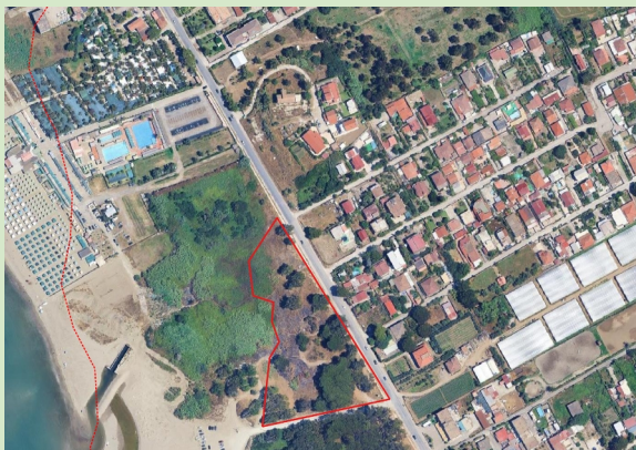
immagine desunta dal portale SIAN