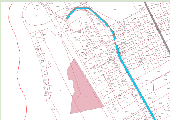
immagine elaborata con mappe Agenzia delle Entrate