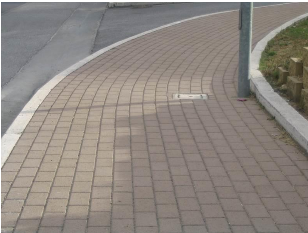
Foto n. 1 – Tipologia di pavimentazione in masselli di calcestruzzo