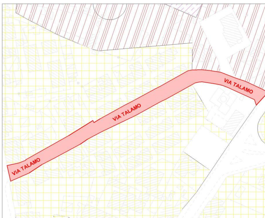
Fig. n. 2 - Stralcio P.R.G.