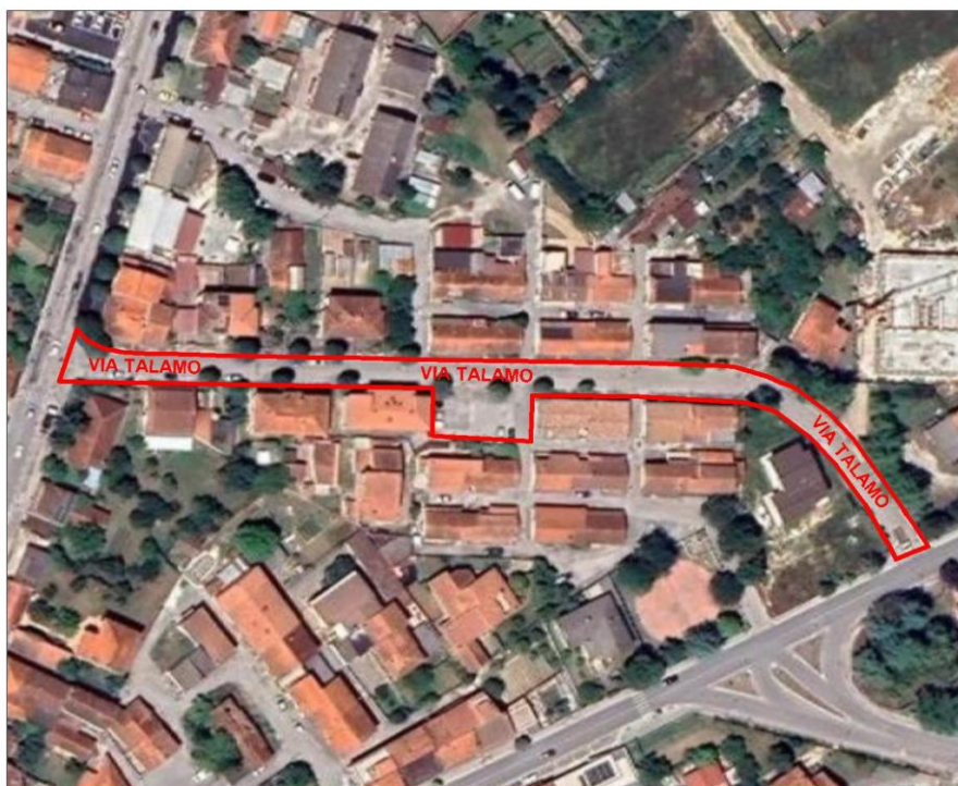
Fig. n. 4 - Foto Aerea