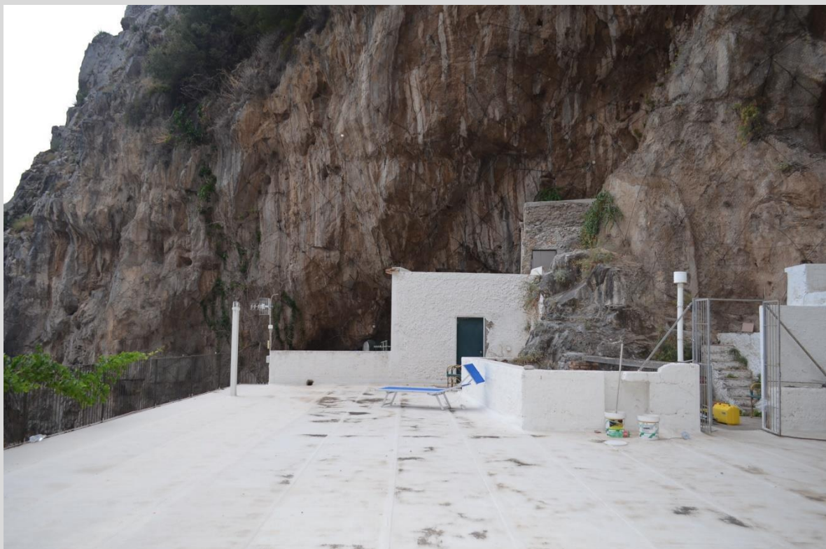
Riprese fotografiche del fabbricato oggetto di intervento