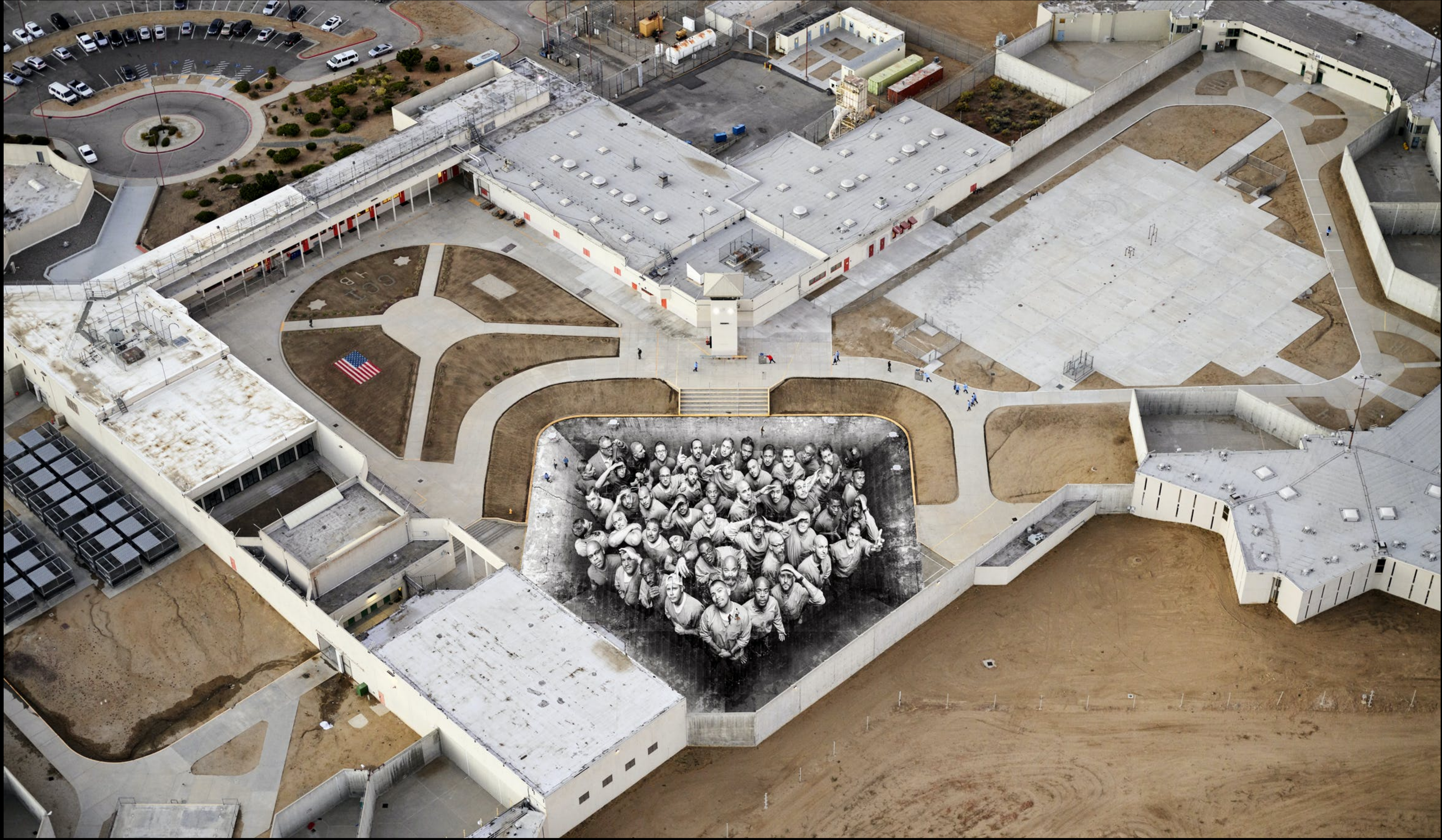
TEHACHAPI, CALIFORNIA CORRECTIONAL INSTITUTION