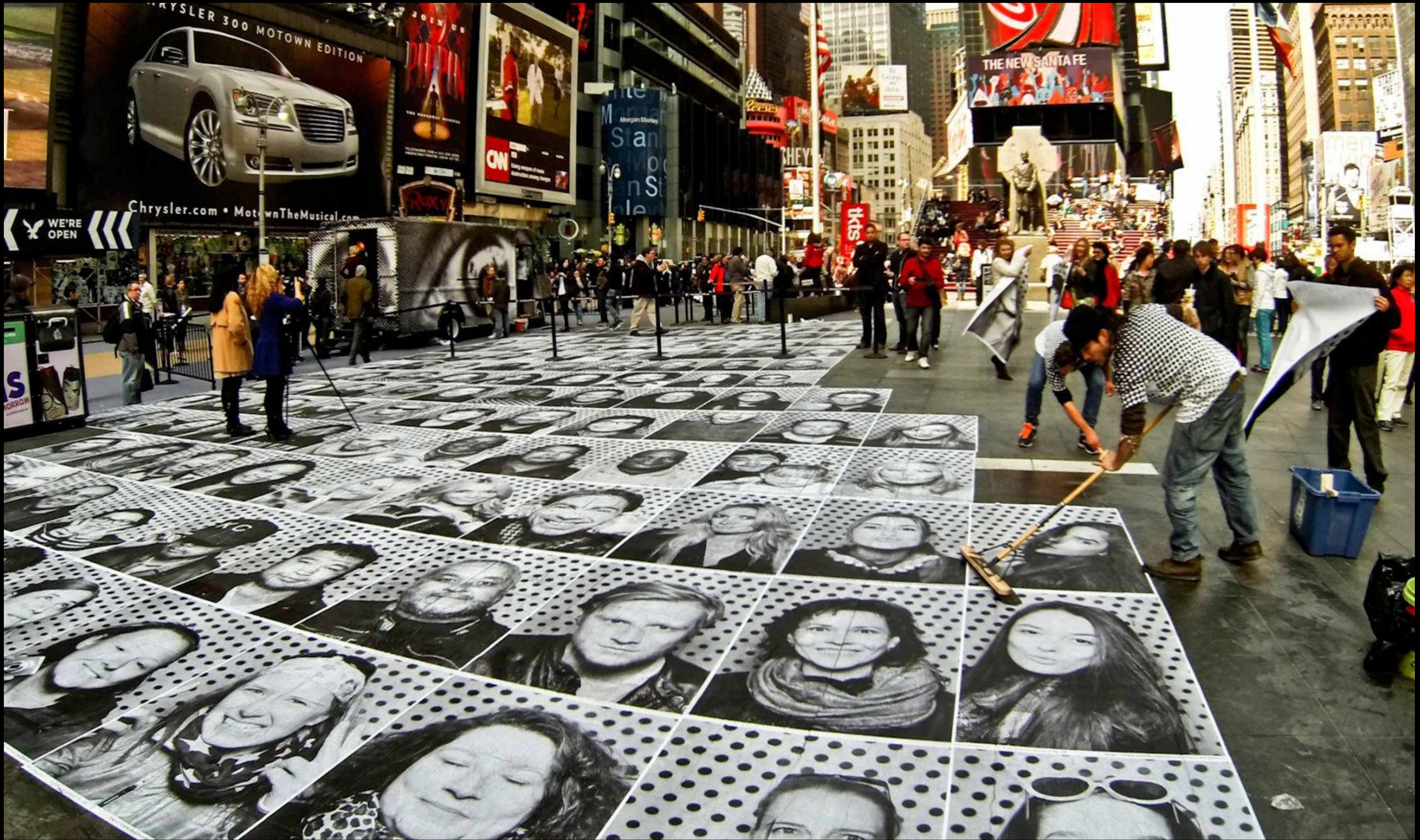
TIME SQUARE, NEW YORK