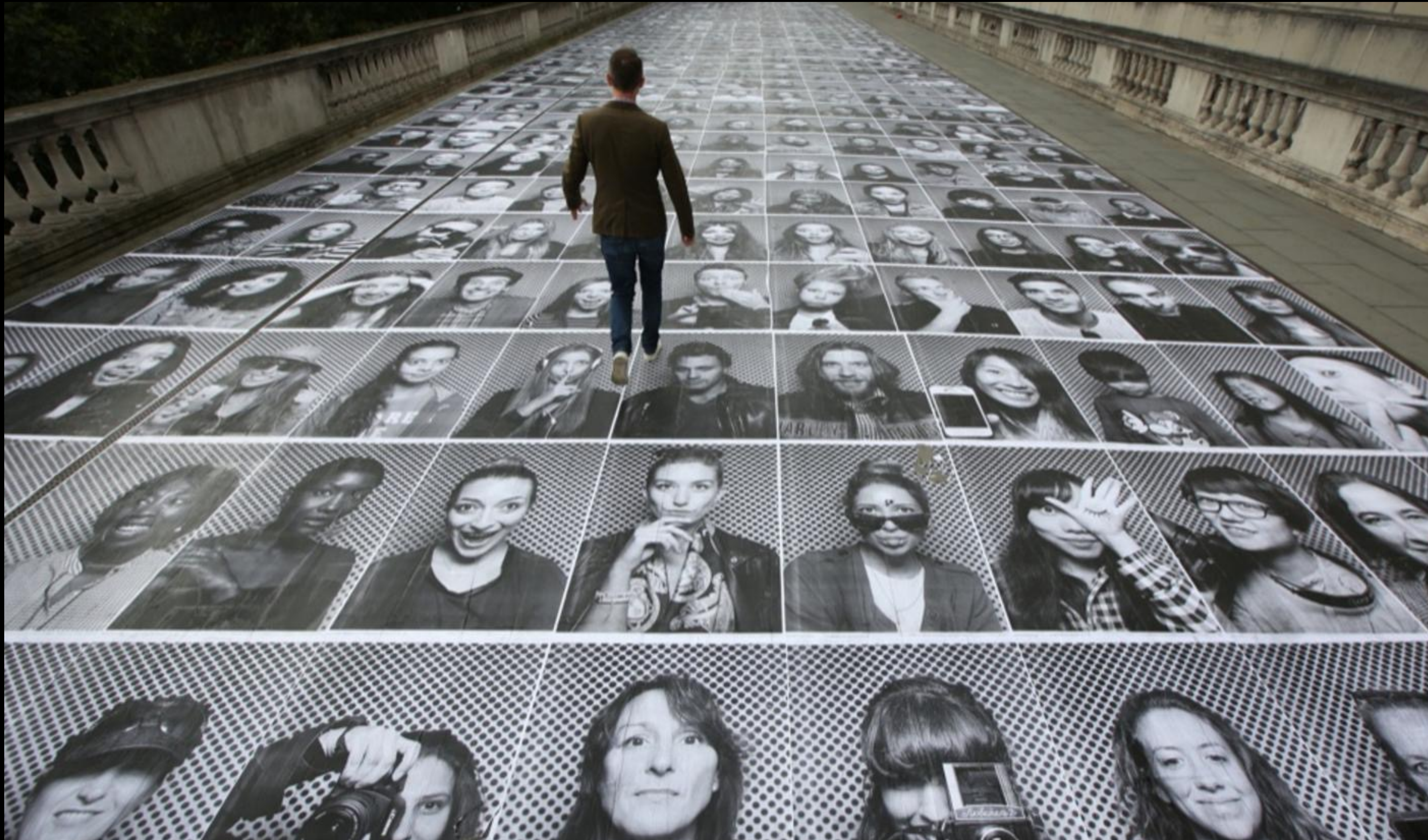
WATERLOO BRIDGE, LONDRA