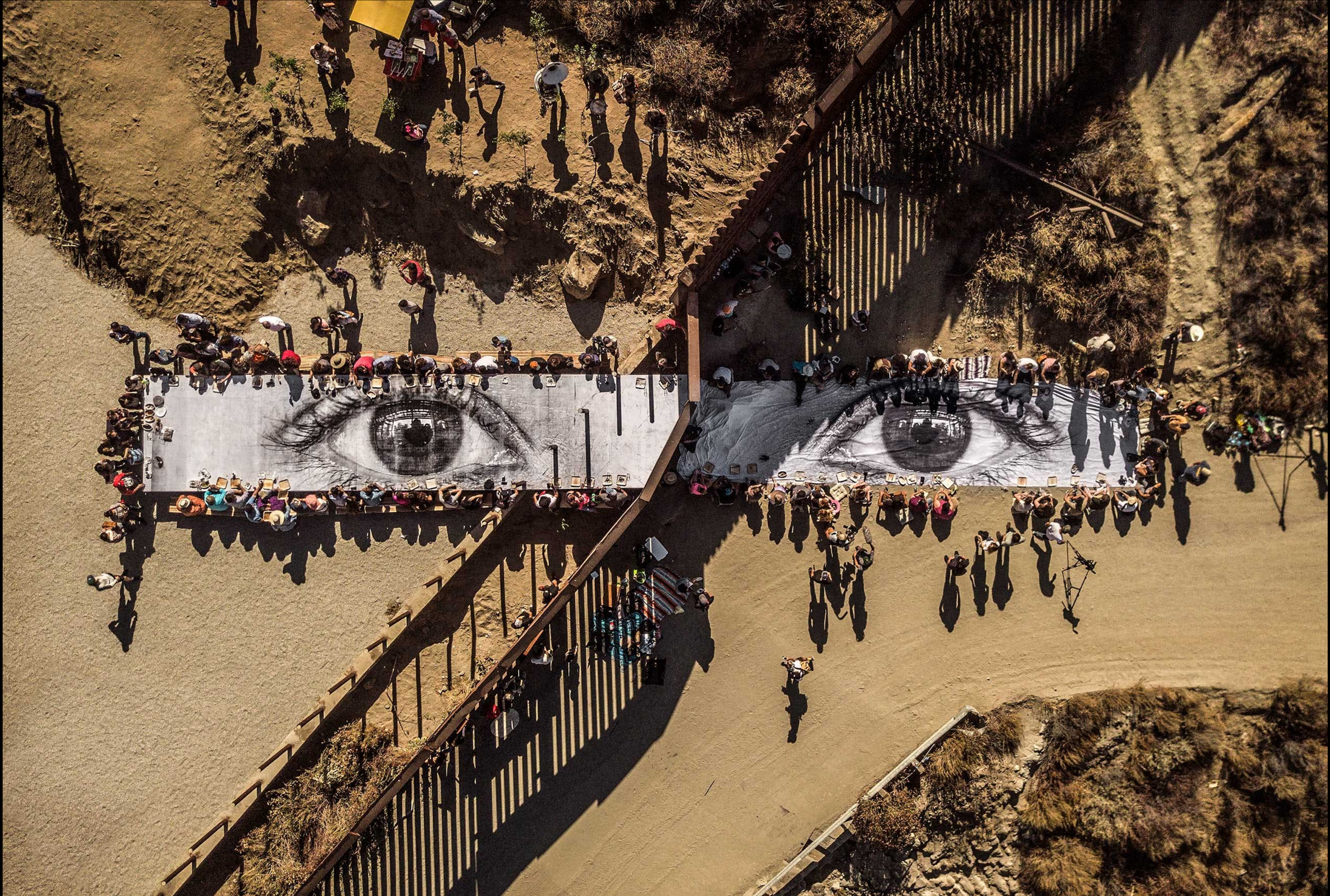
MIGRANTS, TEGATE, MEXICO -USA