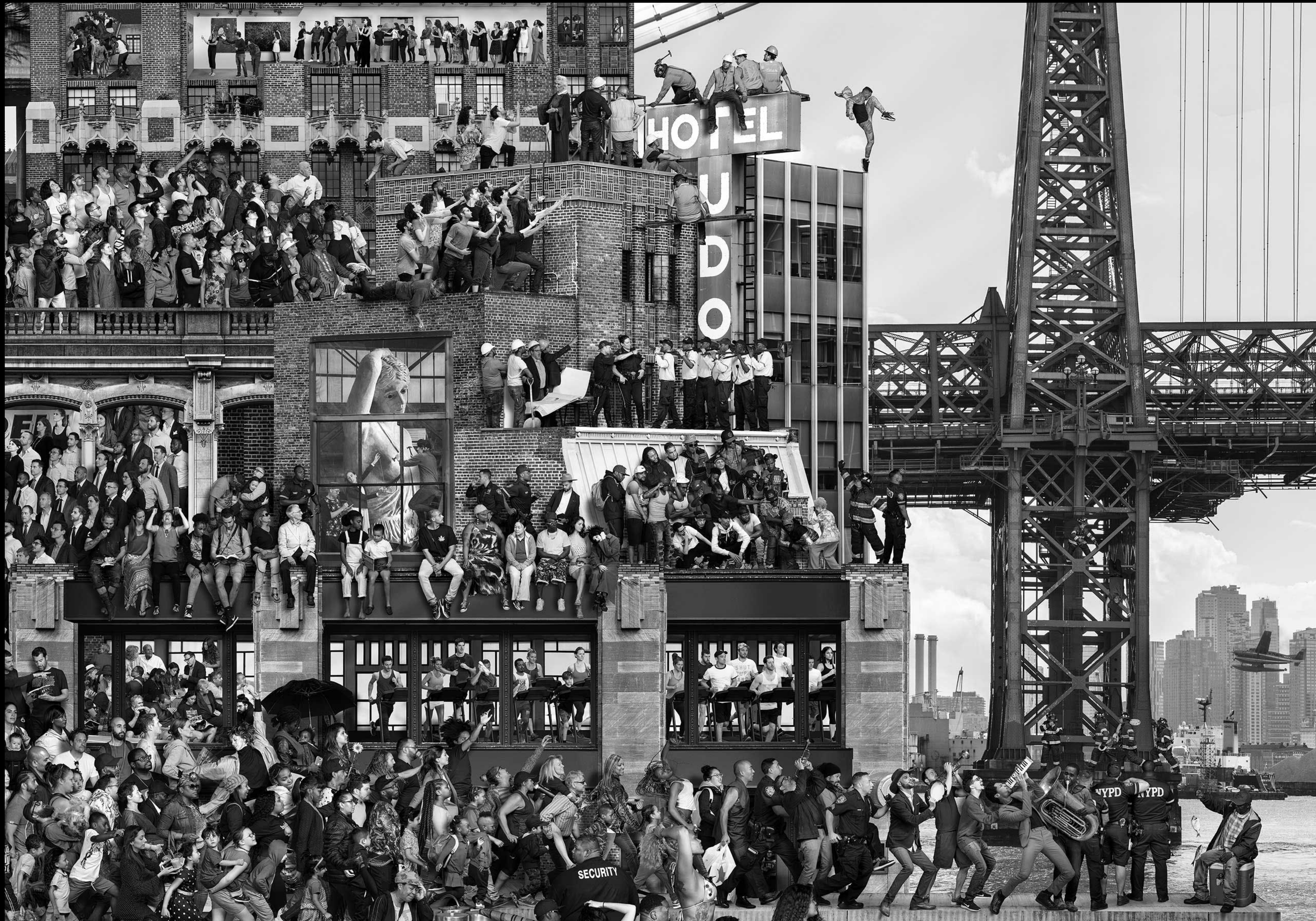
THE CHRONICLES OF NEW YORK CITY