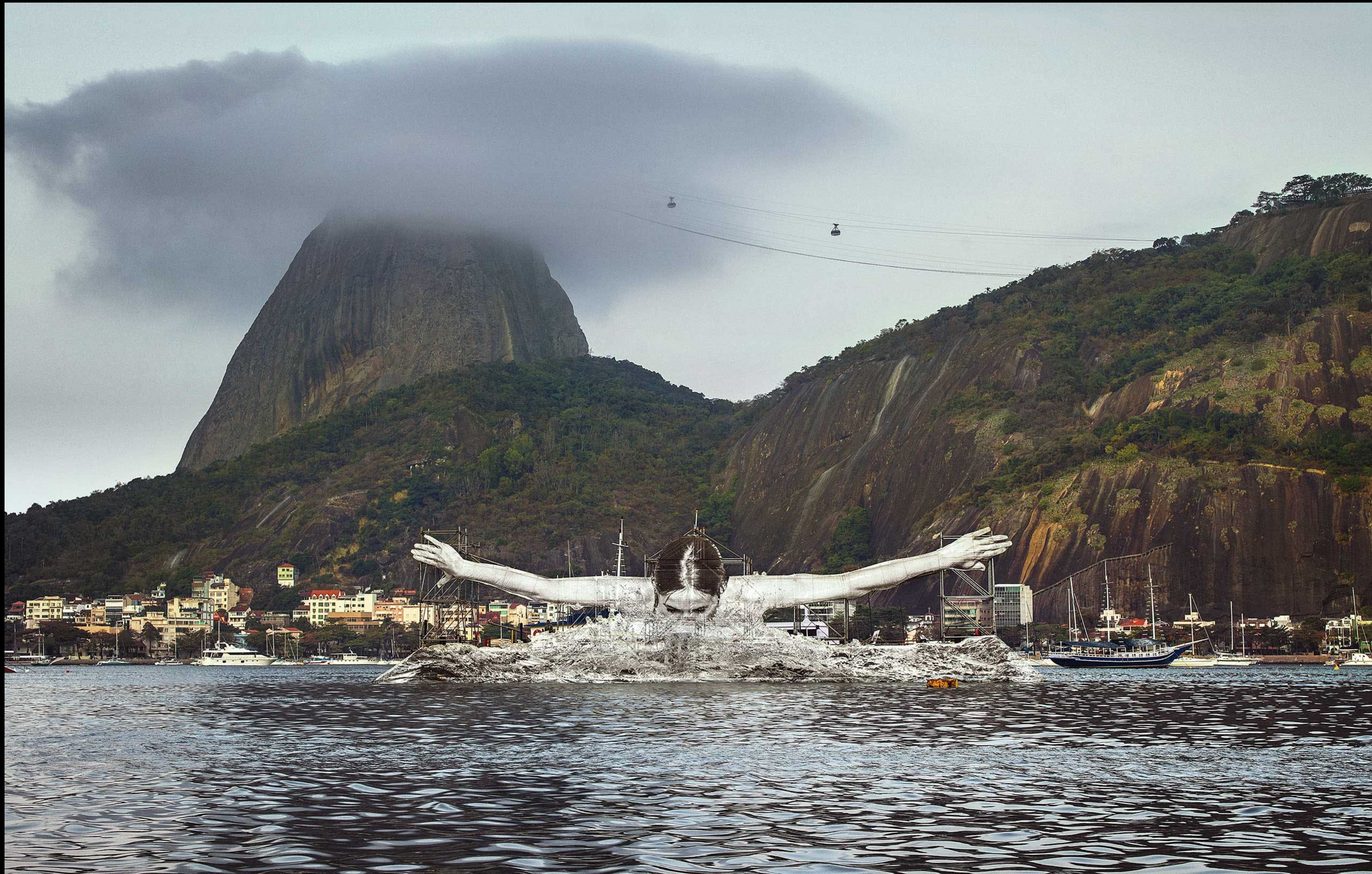
GIANTS, RIO DE JANEIRO