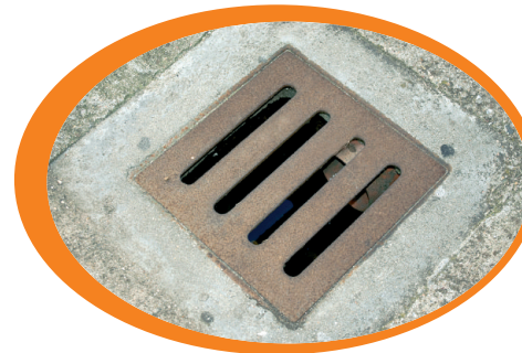
Pulisci accuratamente i tombini e le zone di scolo

Proteggiamoci dalle punture: usiamo zanzariere alle finestre, repellenti e abbigliamento adeguato quando siamo all'aperto soprattutto all'alba e al tramonto.