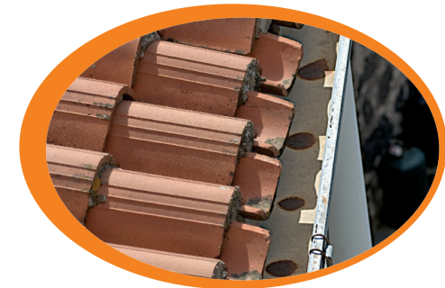
Controlla periodicamente le grondaie mantenendole libere e pulite