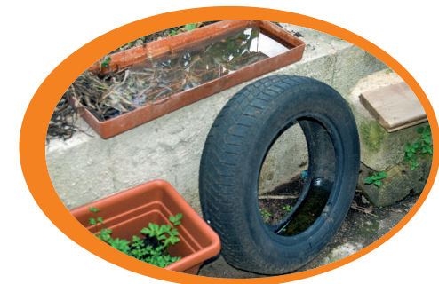
Evita di abbandonare i pneumatici e di far ristagnare l'acqua