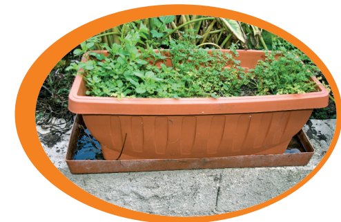
Elimina i sottovasi e, se non puoi toglierli, evita il ristagno d'acqua