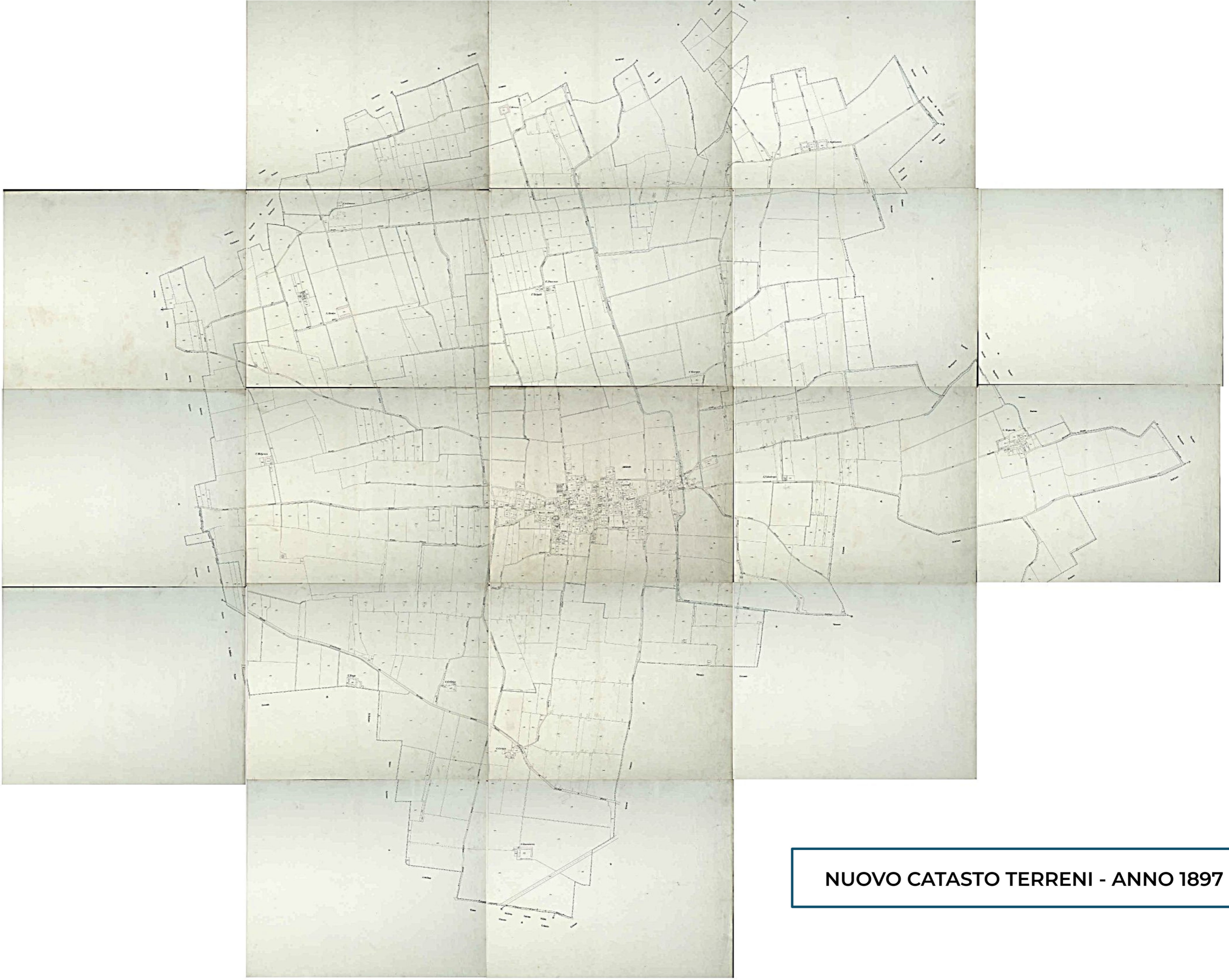
NUOVO CATASTO TERRENI - ANNO 1897