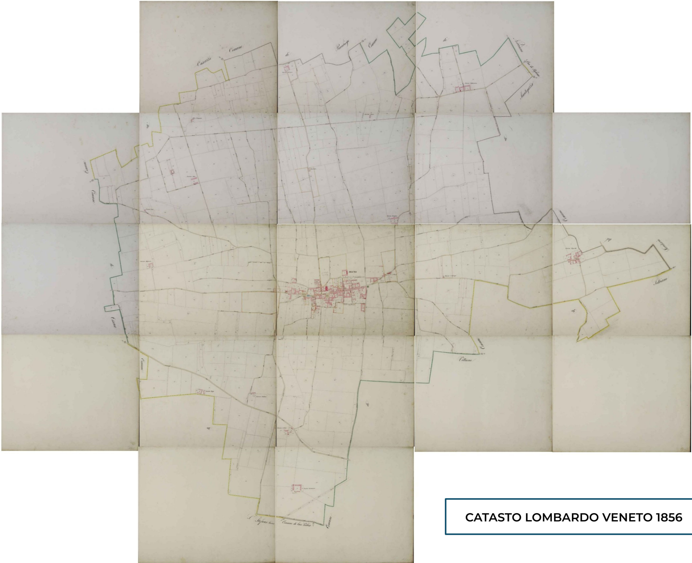
CATASTO LOMBARDO VENETO 1856