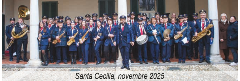
Santa Cecilia, novembre 2025

Maggiori notizie si possono rintracciare a partire dal secolo successivo, quando spesso troviamo il complesso filarmonico citato sulla "Cronaca Prealpina". In tempo di guerra la banda sopravvisse tra alti e bassi, ricordi gloriosi sono legati agli anni trenta, mentre difficile fu la riorganizzazione al termine dei conflitti mondiali. Diverse notizie in proposito si possono trovare nella pubblicazione "Storie di gente, di musica ed altro ancora" di Pier Giorgio Larroux (Nicolini editore, 1996) che se-