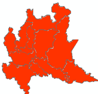
DOMANI SABATO 27/06