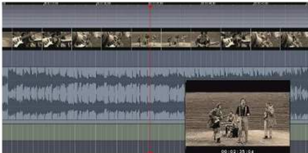
Figura 1 Esempio di una timeline semplice di un file multimediale con una traccia video (monoscopica) e una traccia audio binaurale (2 canali stereo).