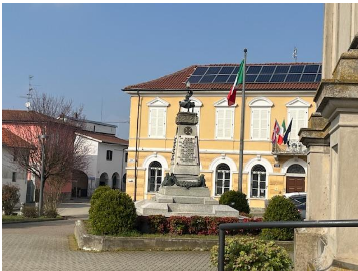
Scorcio di piazza Vittorio Veneto a Rive (VC)

ex art. 6 del D.L. 9 giugno 2021, n. 80, convertito con modifiche dalla Legge 6 agosto 2021, n. 113