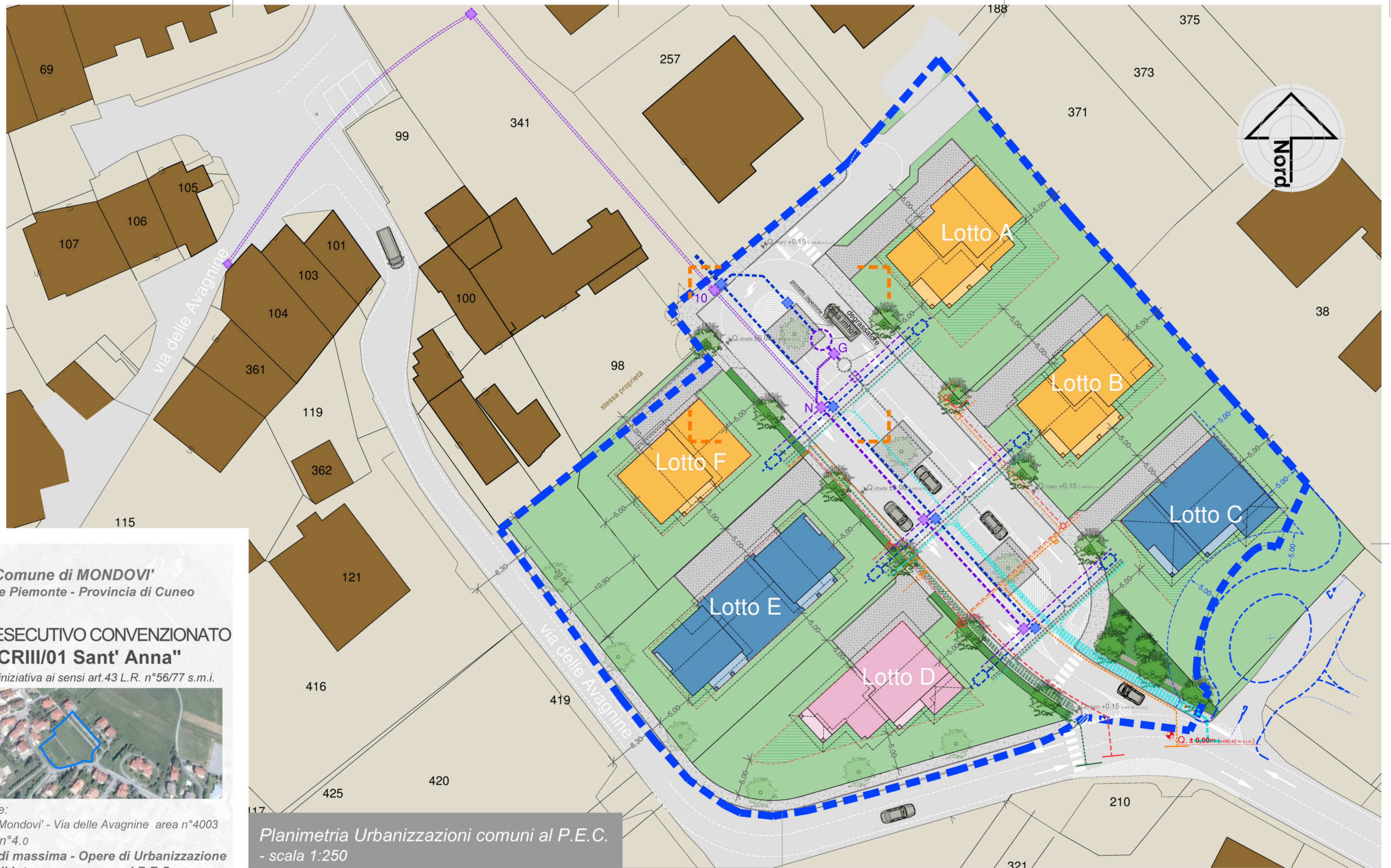
Planimetria Urbanizzazioni comuni al P.E.C. - scala 1:250