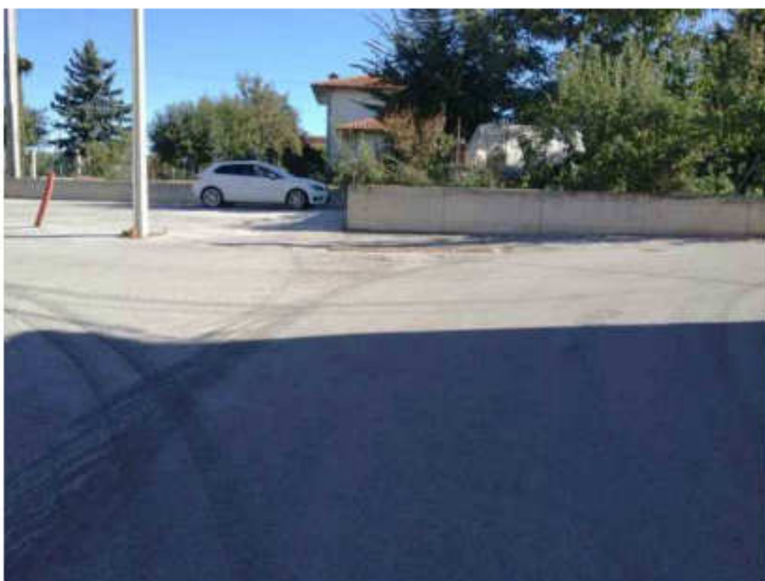
Vista di Via Delle Avagnine a monte