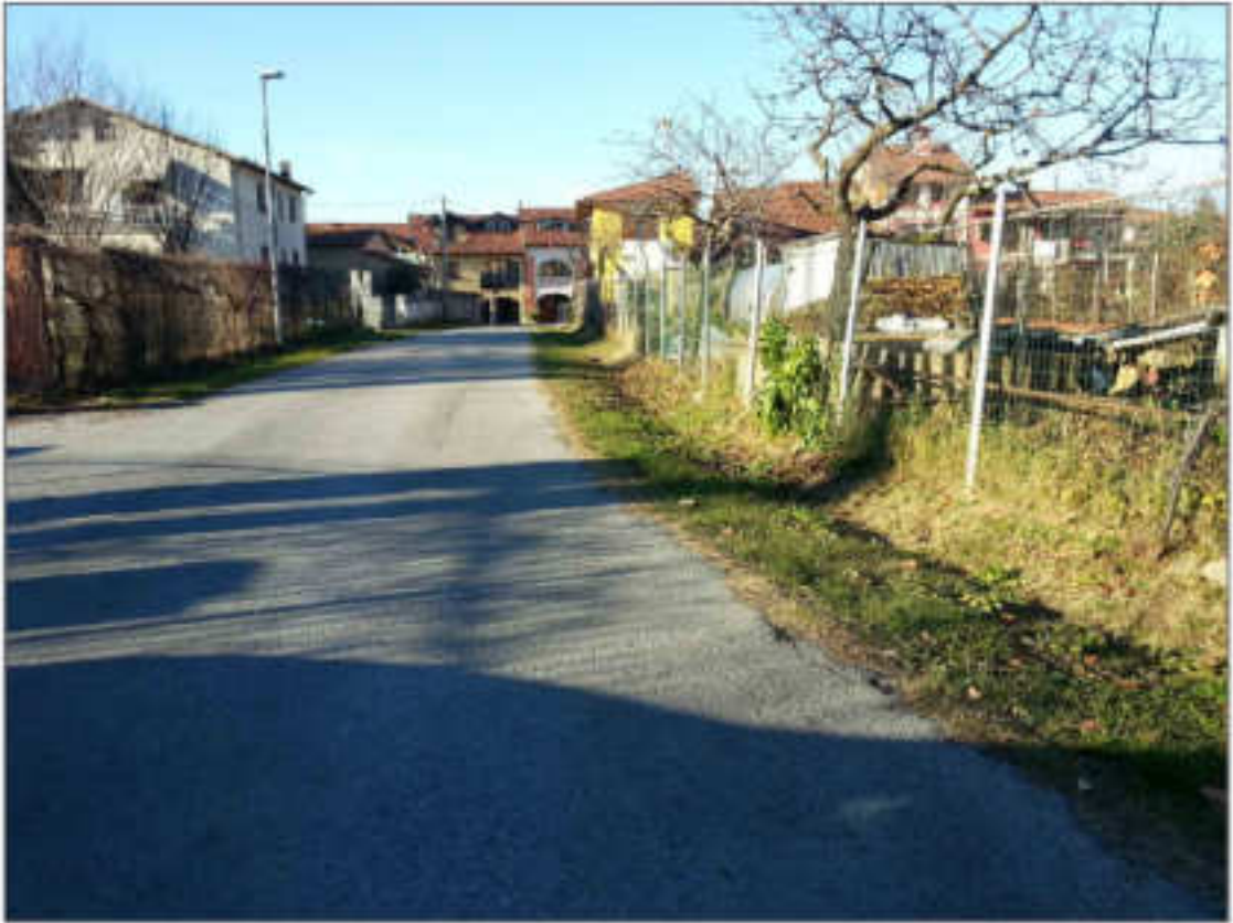
Viste di Via Delle Avagnine