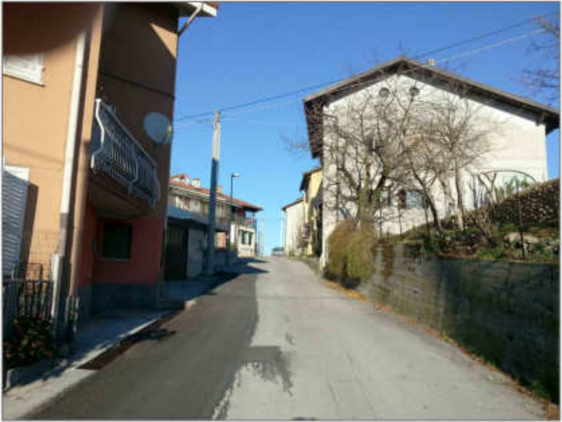
Viste di Via Delle Avagnine