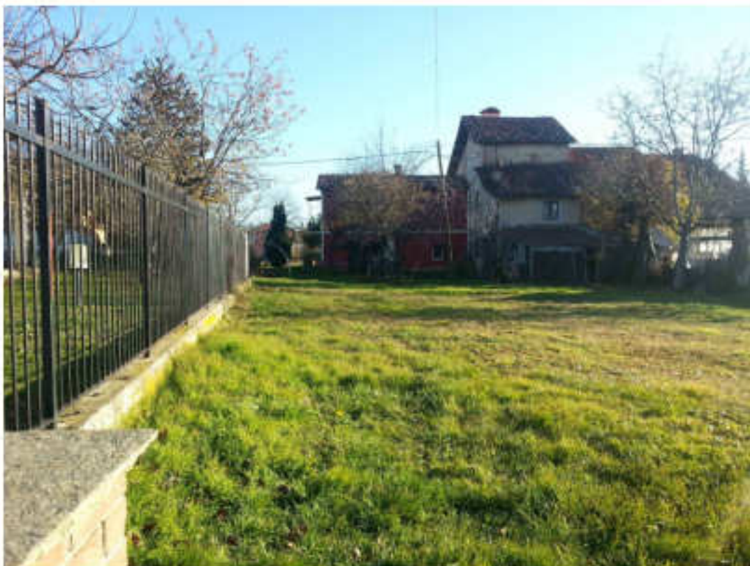
Vista tratto di proprietà Tomatis R.e D. (proponenti)