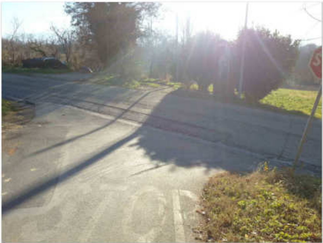
Vista attraversamento di Via S.Anna