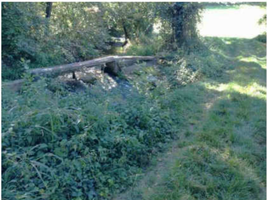
Vista Rio Pesce