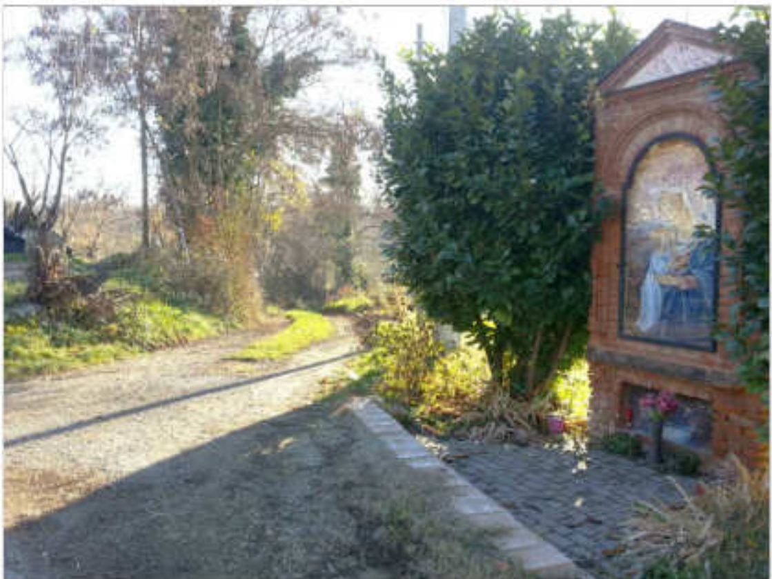
Vista viabilità poderale verso Rio Pesce