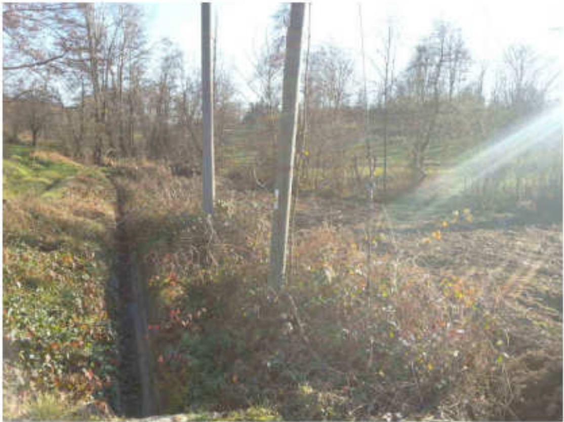
Vista zona di transito parallela Canale Cornetta