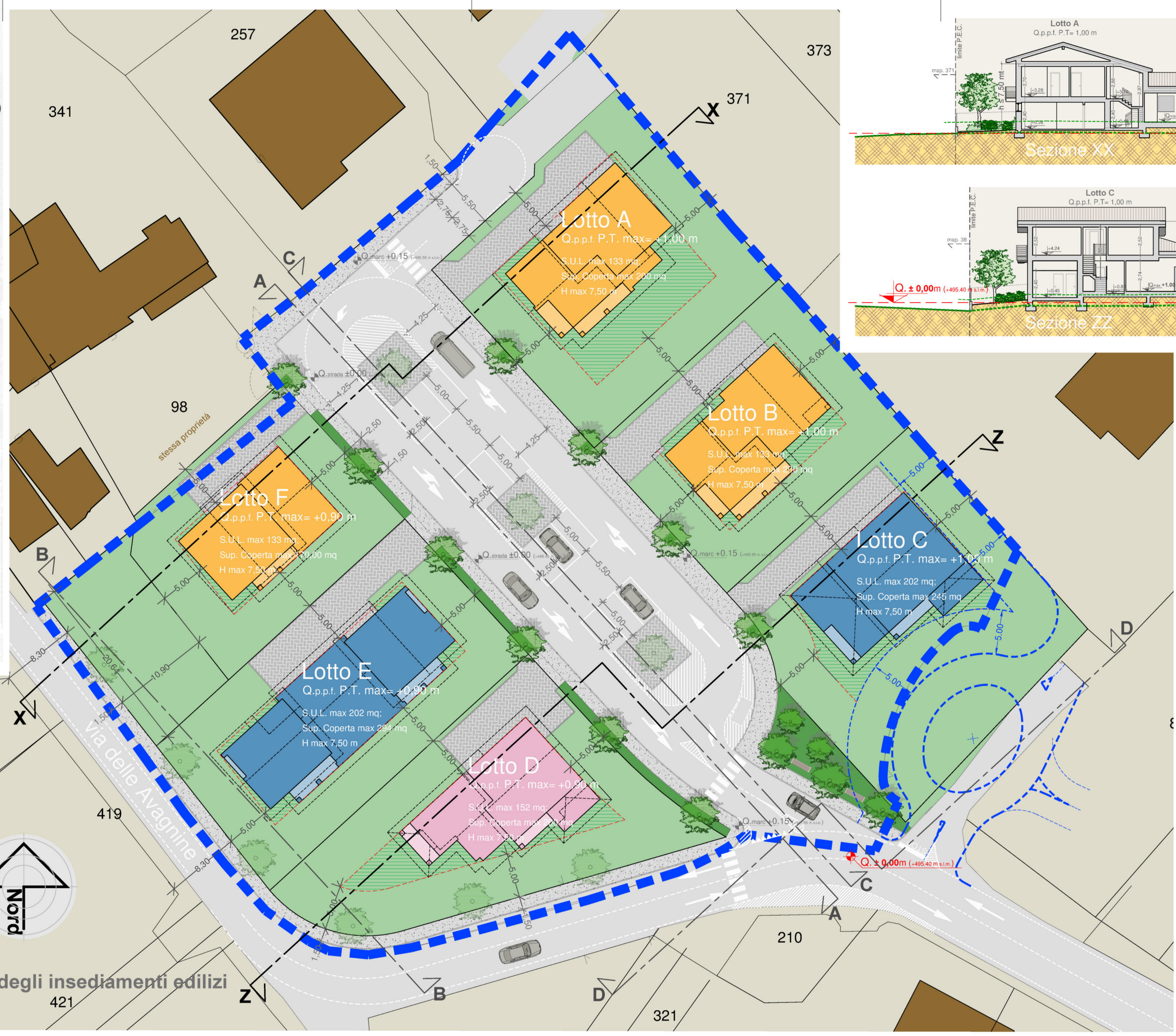
Planimetria degli insediamenti edilizi scala 1:250