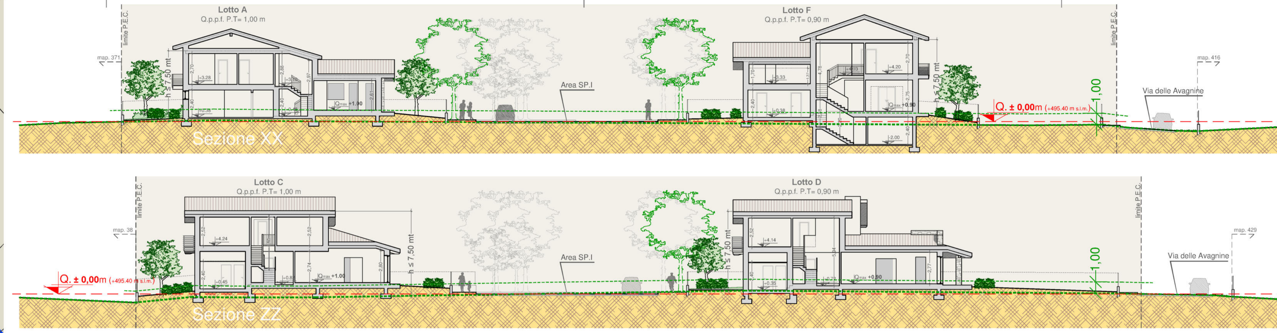
Sezioni Trasversali -scala 1:250