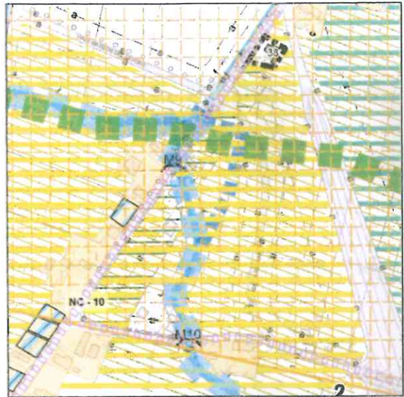
Tav. 1.1.1 variante