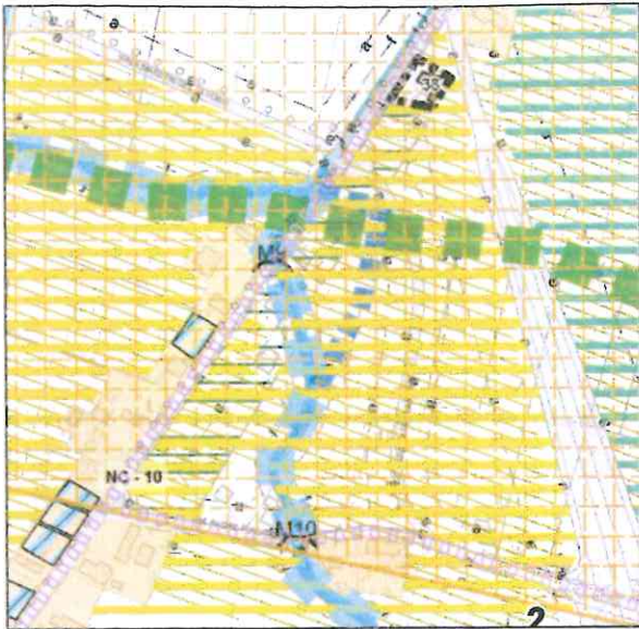
Tav. 1.1.1 vigente