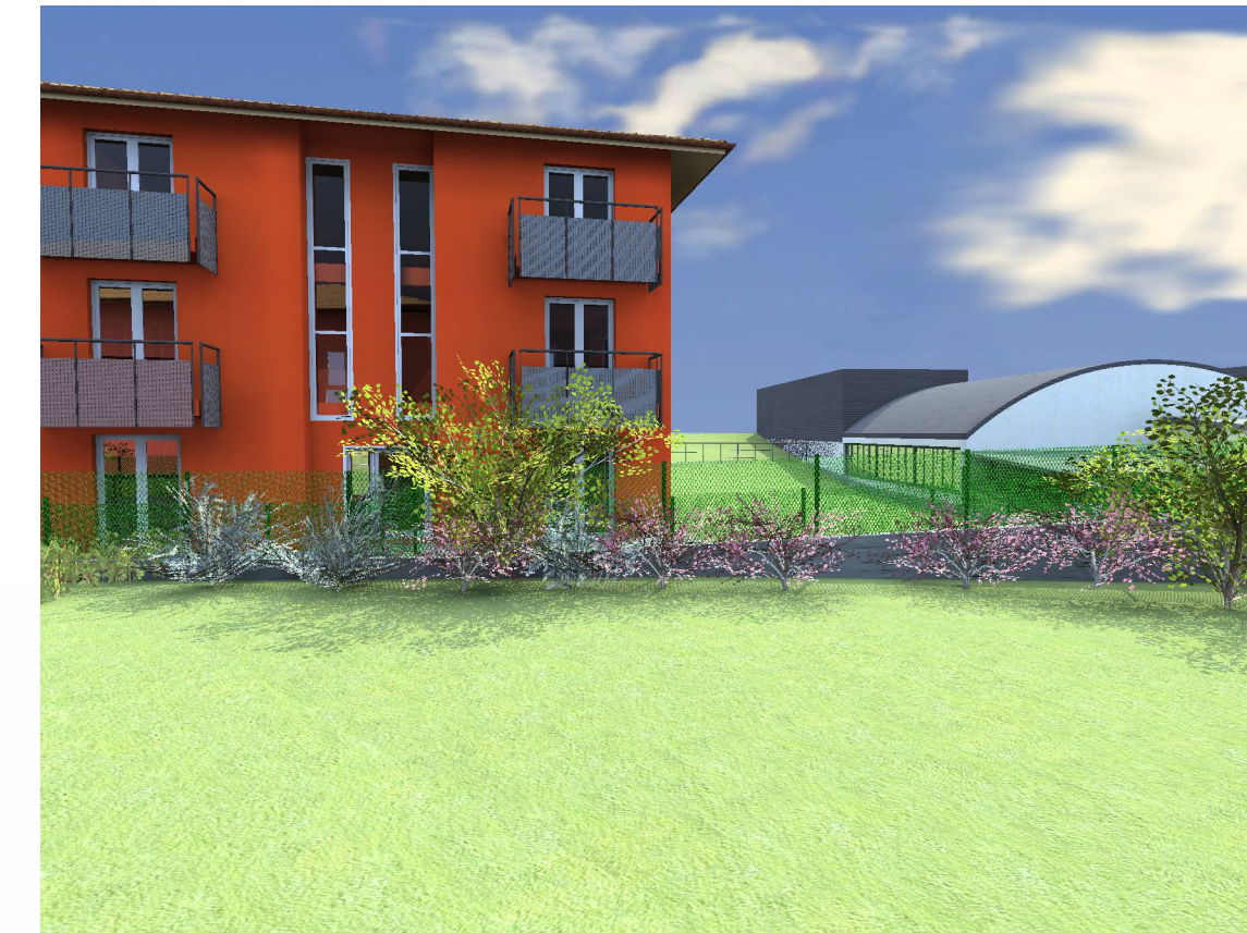
VISTA DALL'EDIFICIO RESIDENZIALE ESISTENTE