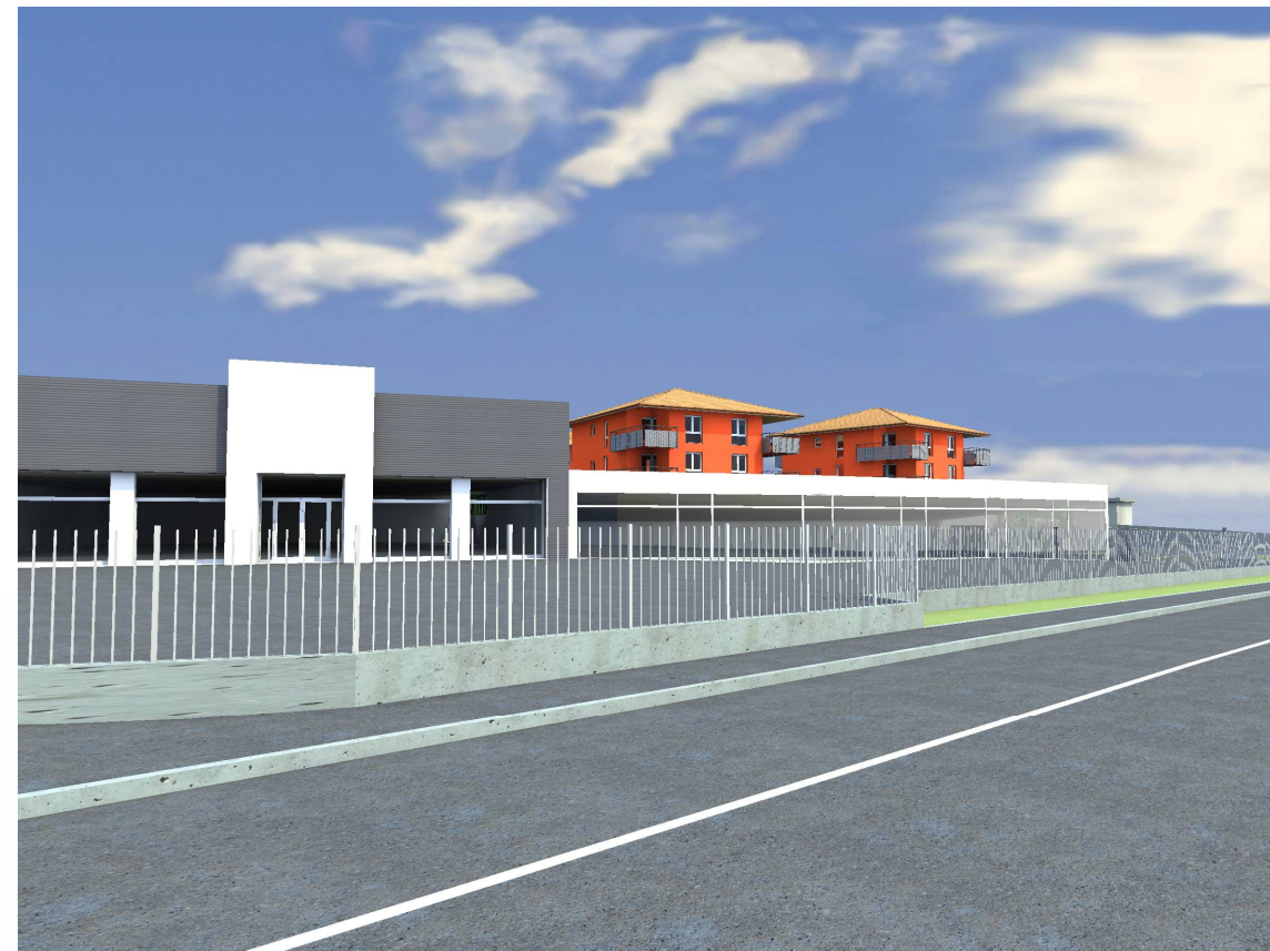
VISTA DALLA STATALE n. 342 BRIANTEA