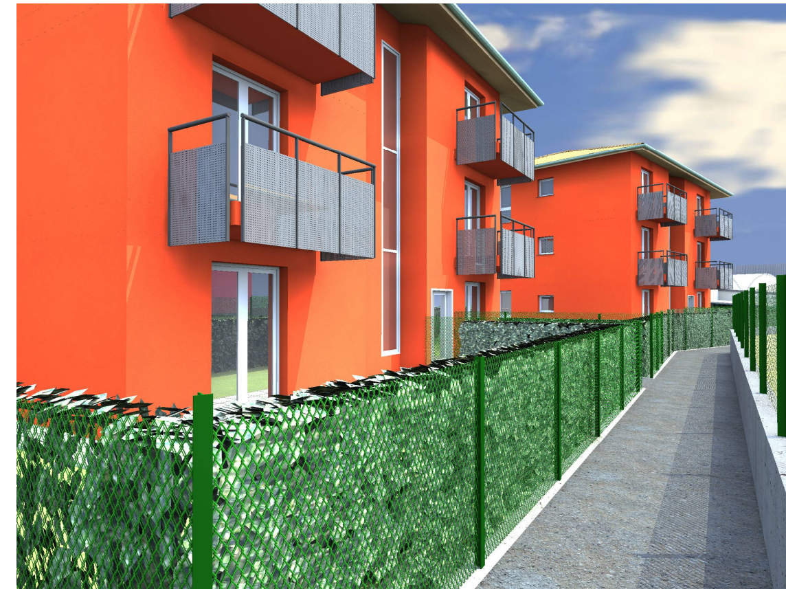
VISTA DAL PERCORSO PEDONALE IN PROGETTO TRA LA VIA CAMPACCIO E LA STATALE n. 342