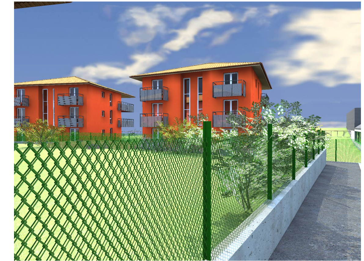
VISTA DAL PERCORSO PEDONALE IN PROGETTO TRA LA VIA CAMPACCIO E LA STATALE n. 342