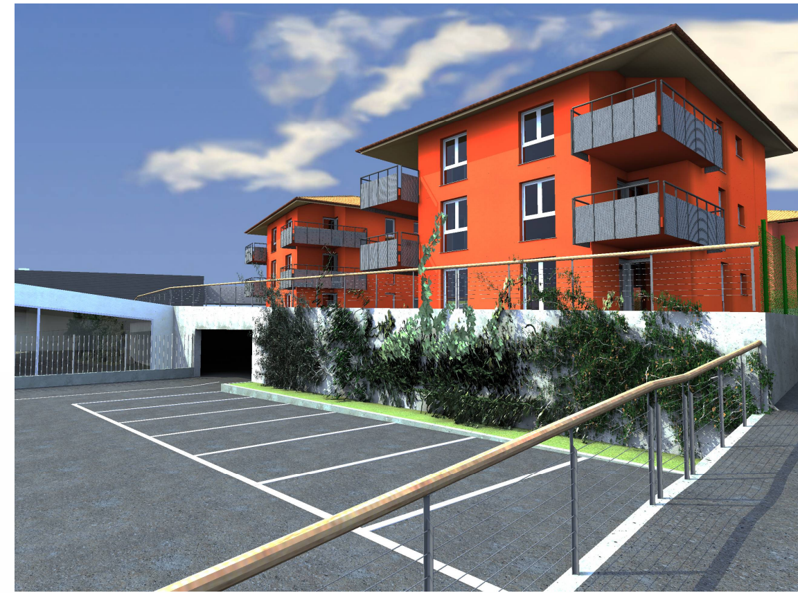
VISTA DAL PARCHEGGIO PUBBLICO IN PROGETTO