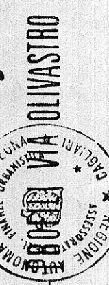
TAVOLA N° 10 bis progetto di P.P. ADOTTATO IL APPROVATO IL