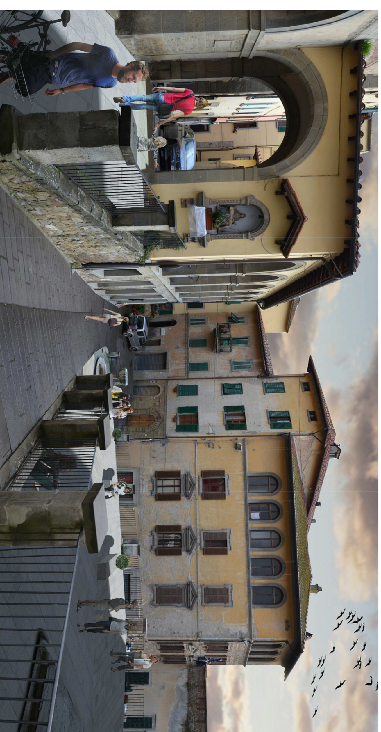
Fotoinserimento 2 _ veduta della Piazza del Collegio da via Roma