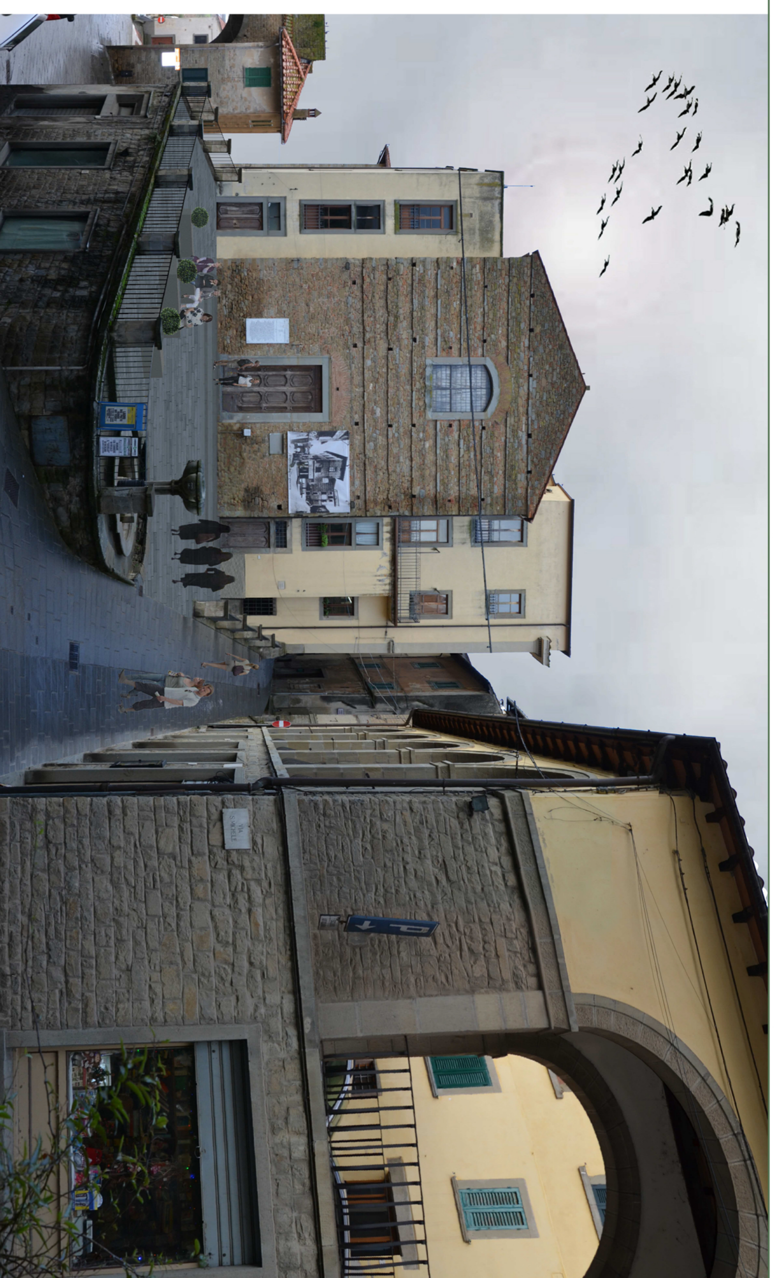
Fotoinserimento 1 _ veduta della Piazza del Collegio da via Roma - incrocio via S Michele