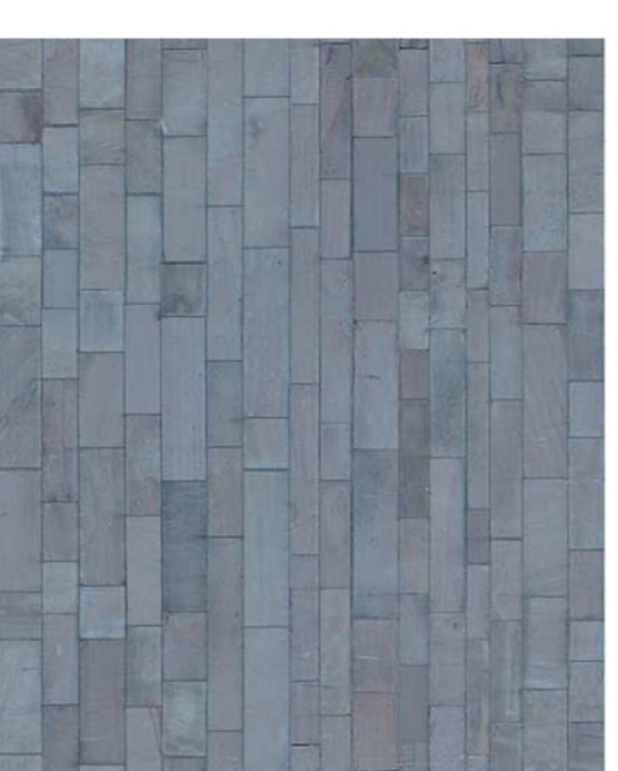
Pavimentazione in pietra