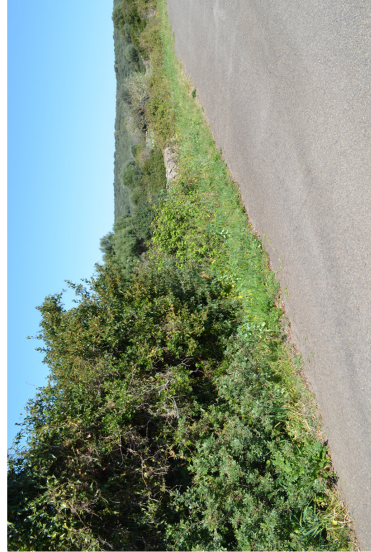
Area intervento C6.C