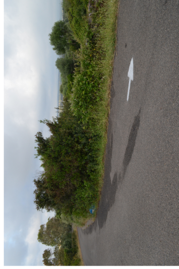
Area intervento C6.B