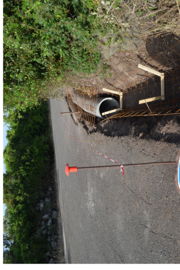
Area intervento C6.C