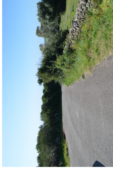
Area intervento C6.A