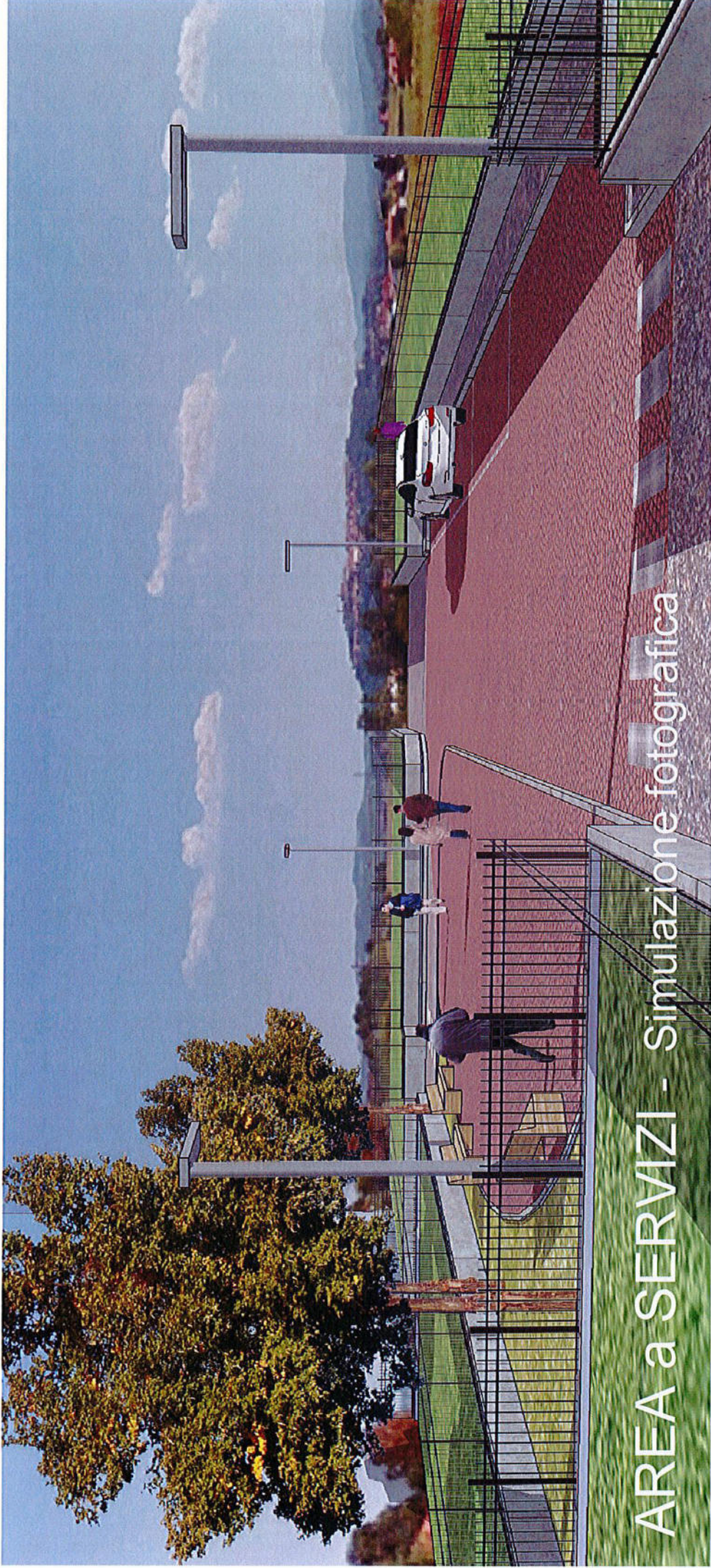
AREA a SERVIZI - Simulazione fotografica