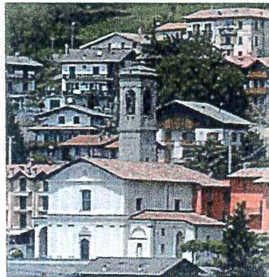
Aviatico - Chiesa Parrocchiale