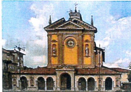
Selvino - Chiesa Parrocchiale