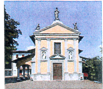
Chiesa di Ama