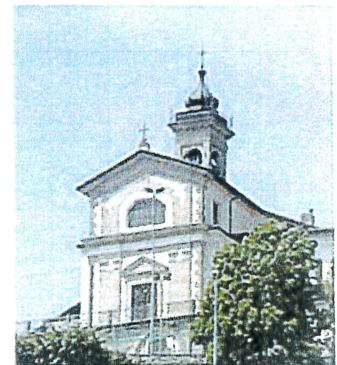
Chiesa di Amora

18.00 SELVINO - S. MARIA DELLA SALUTE 18.30 AMORA