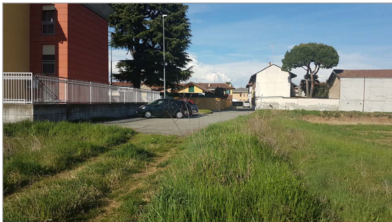
Fotografia n° 10