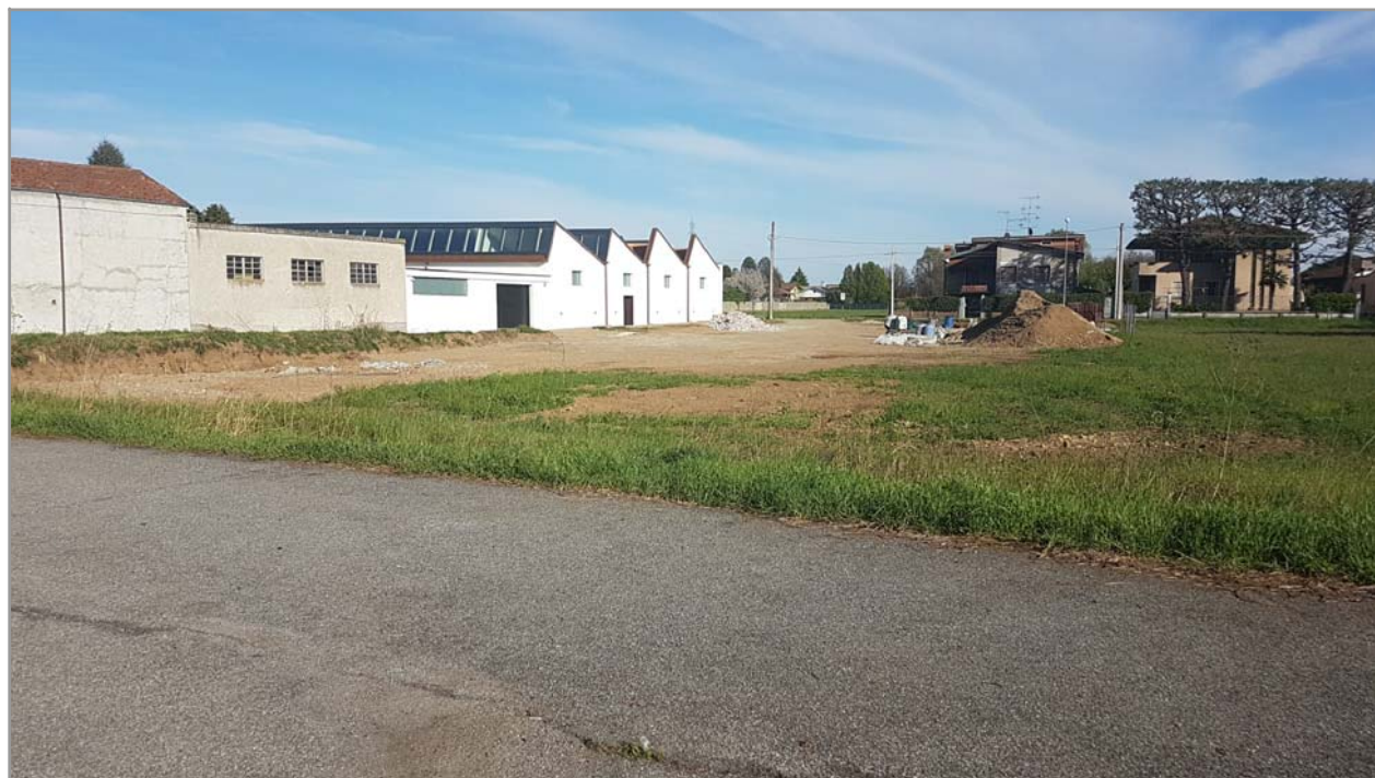
Fotografia n° 9