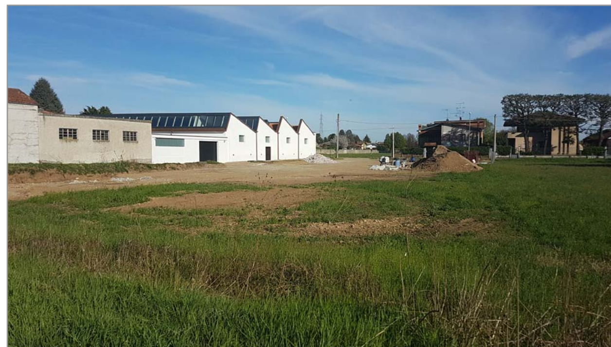
Fotografia n° 11