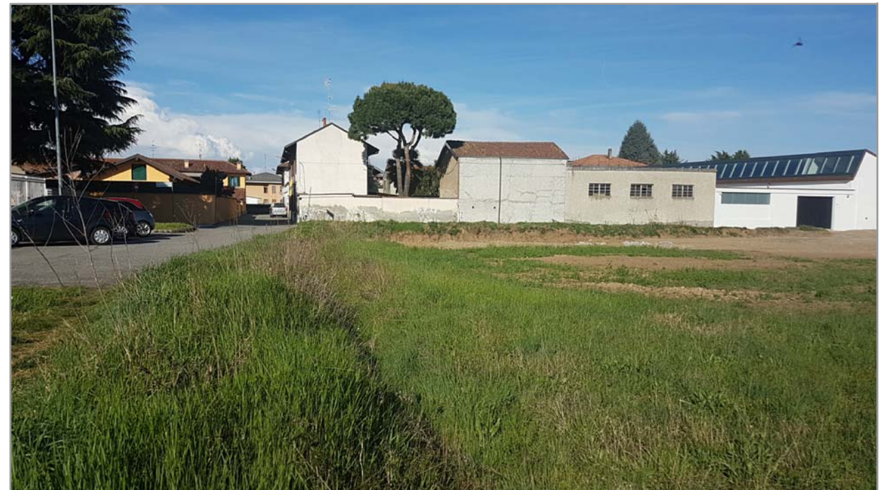
Fotografia n° 4