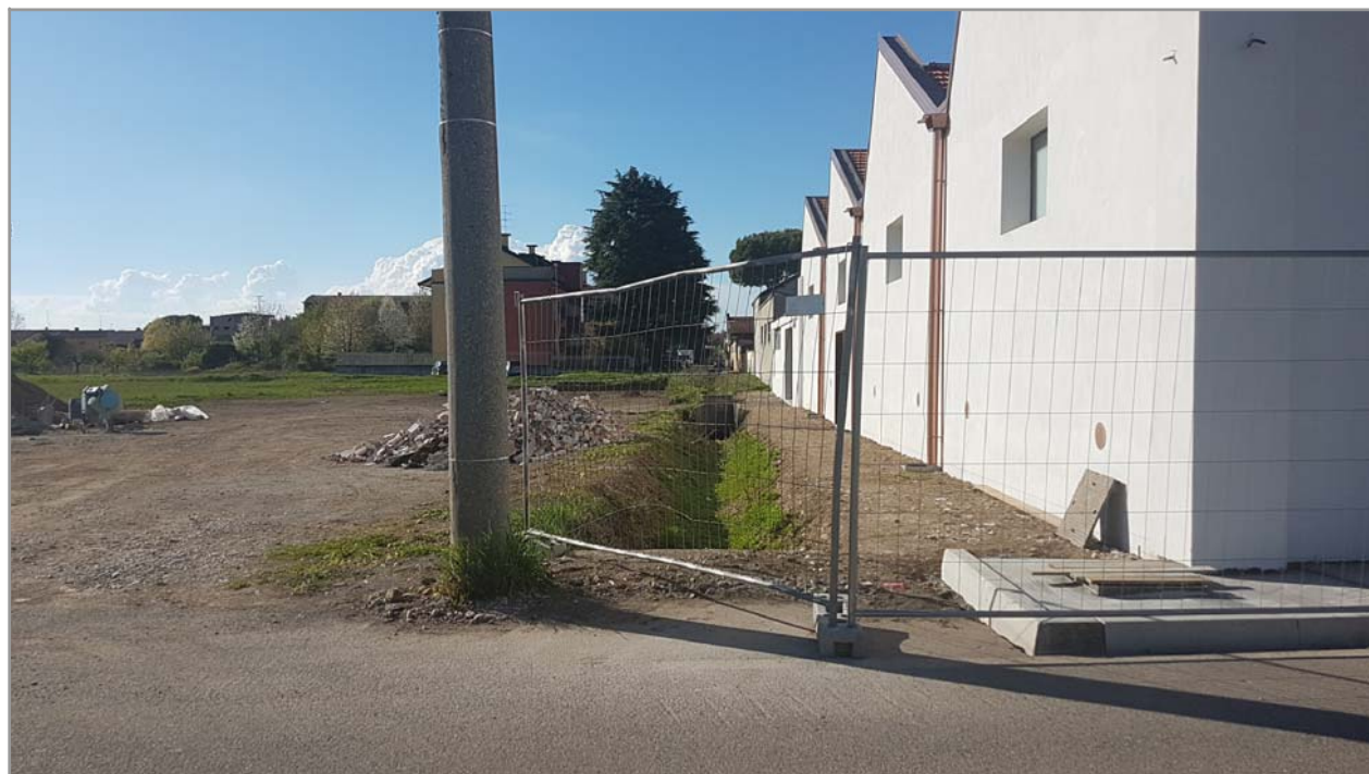
Fotografia n° 17