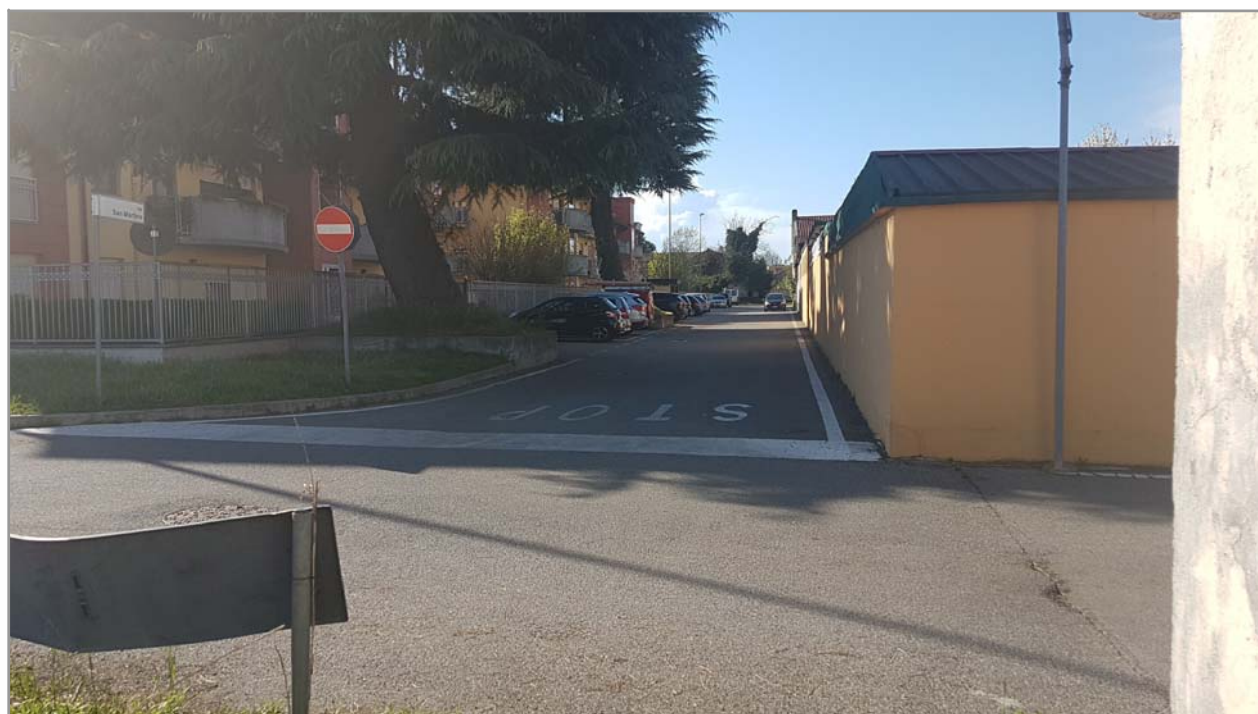
Fotografia n° 13