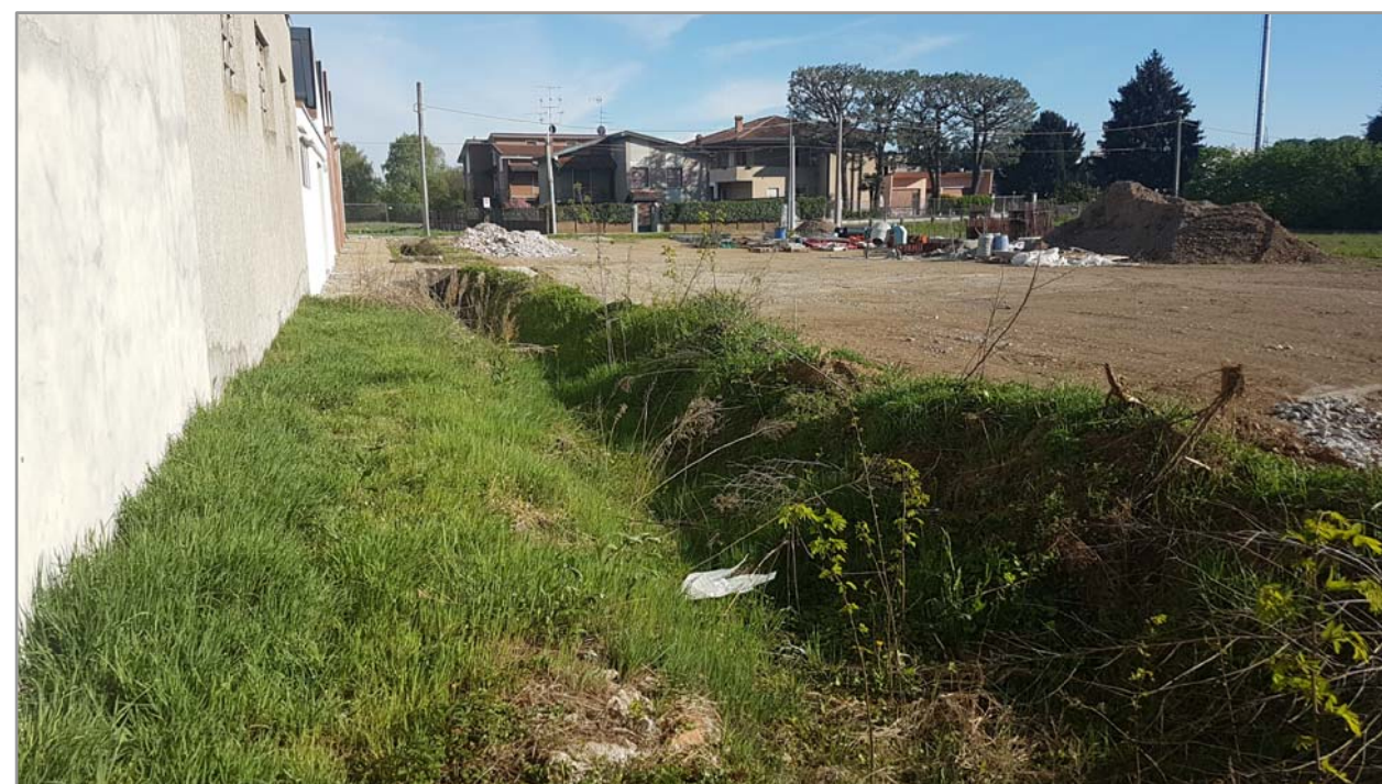
Fotografia n° 12