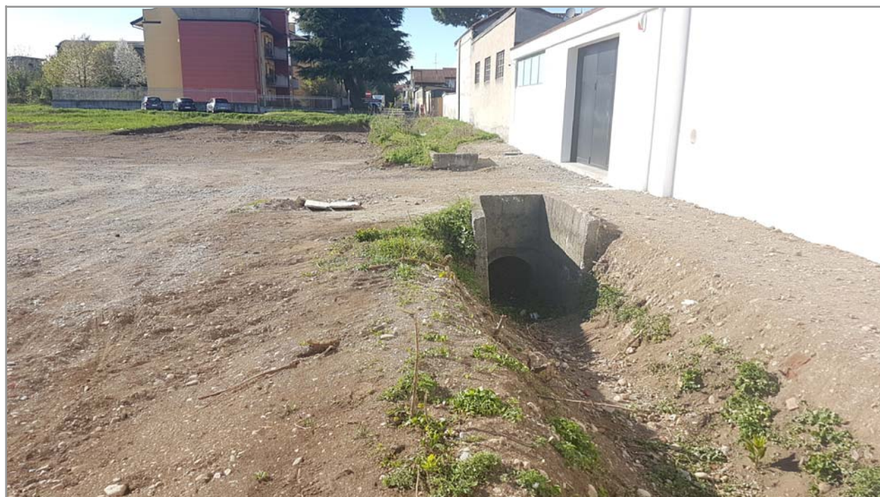
Fotografia n° 18