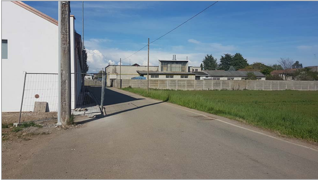
Fotografia n° 5