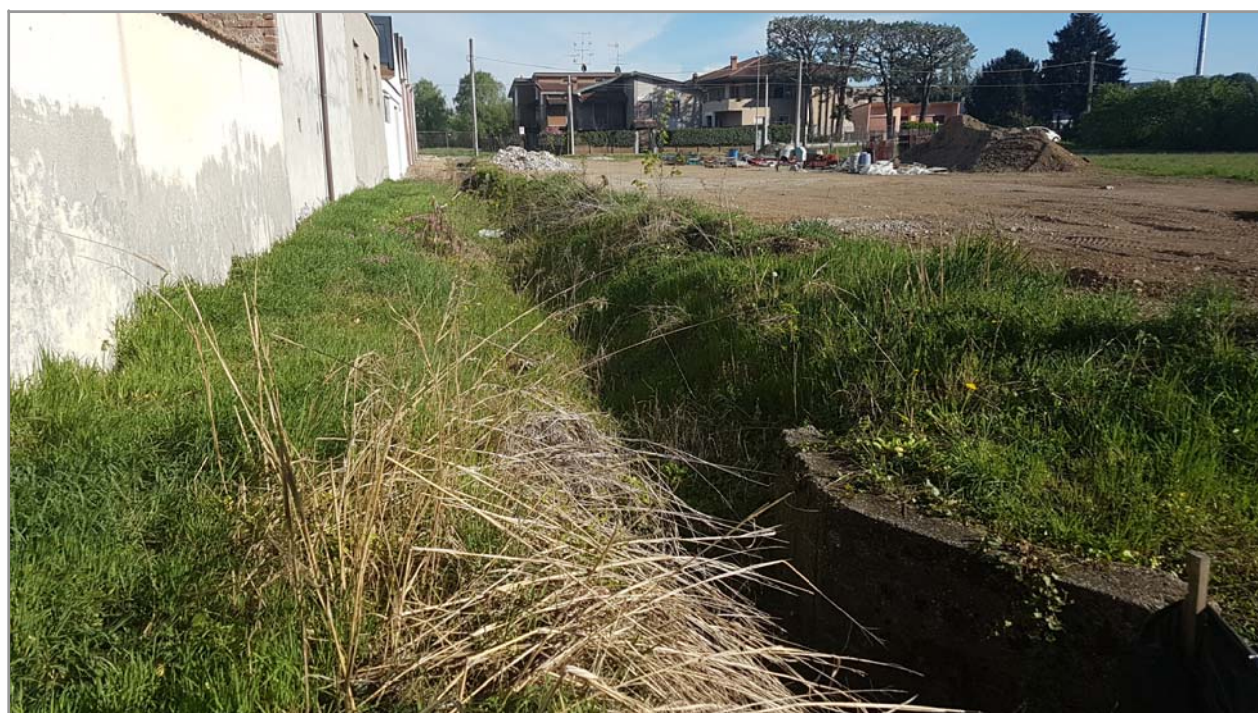
Fotografia n° 14