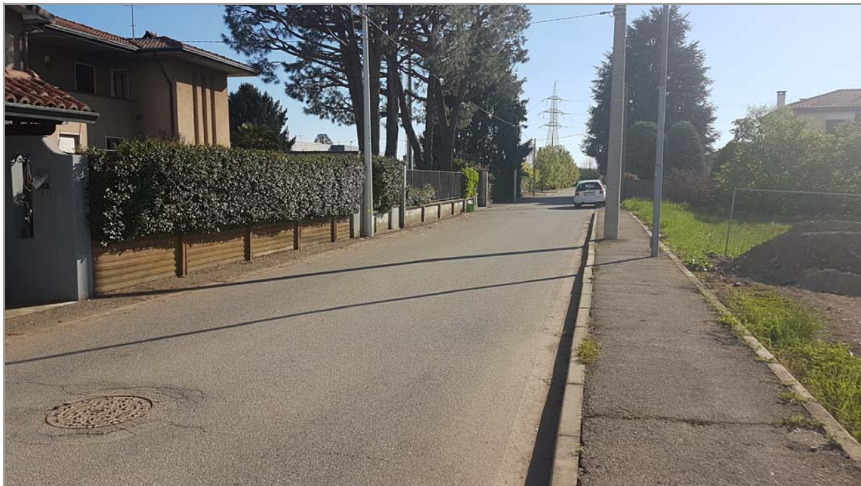
Fotografia n° 6