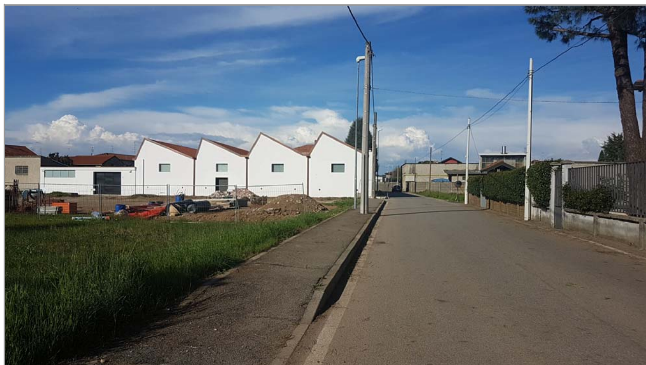
Fotografia n° 2