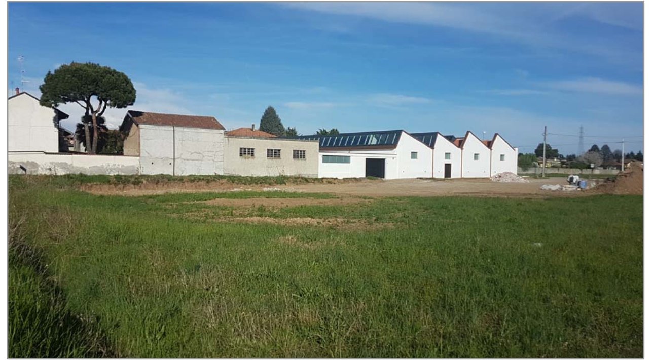
Fotografia n° 3