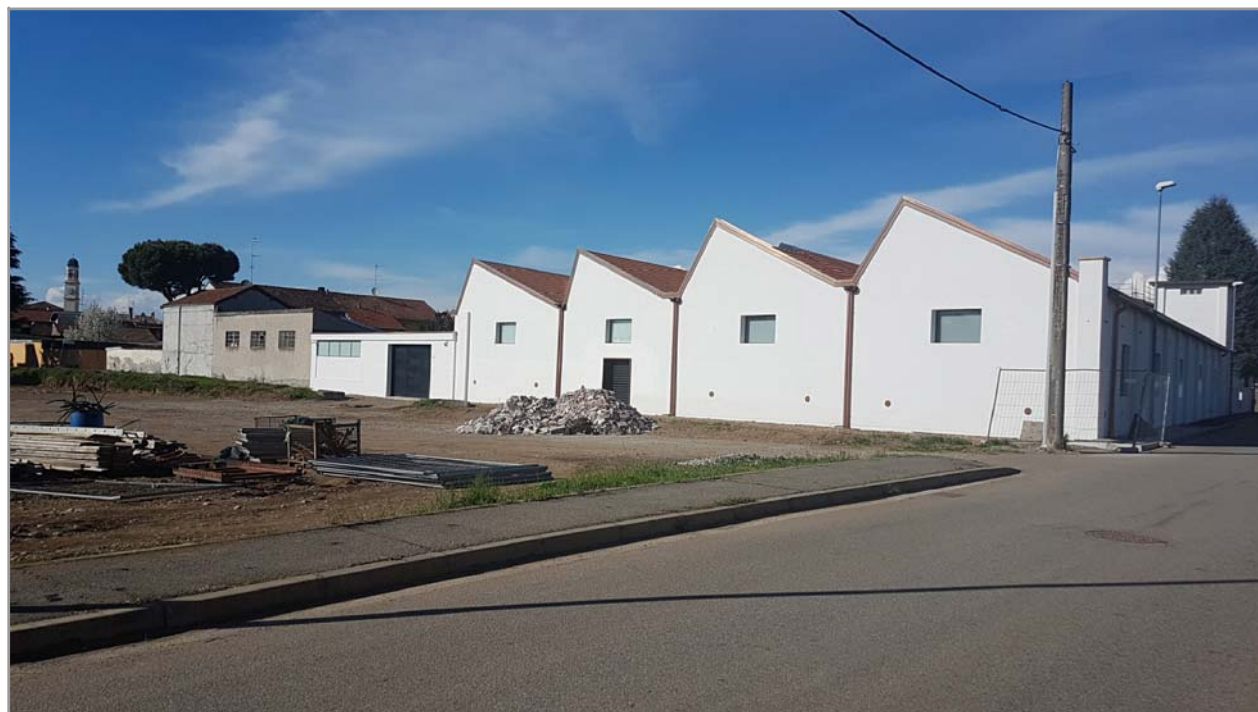
Fotografia n° 1