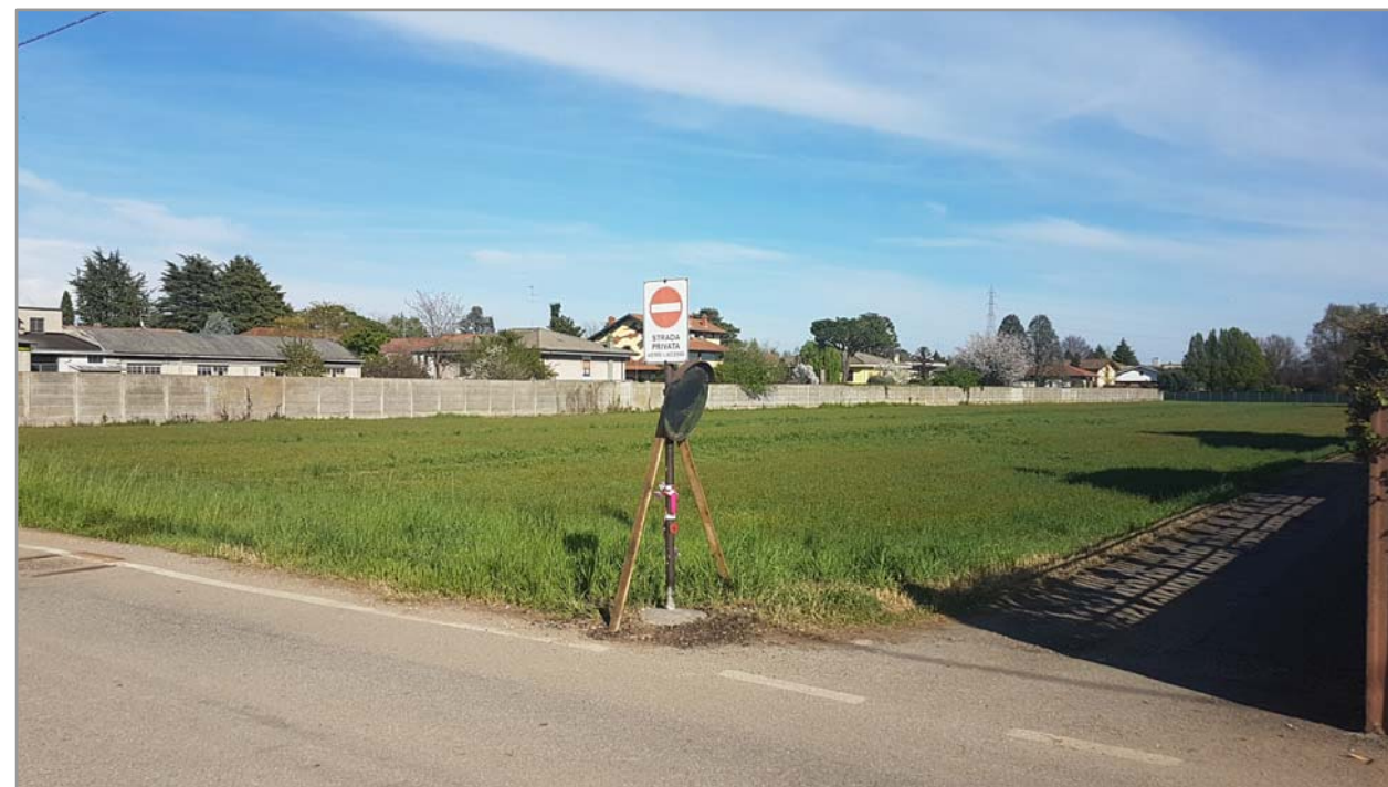
Fotografia n° 15