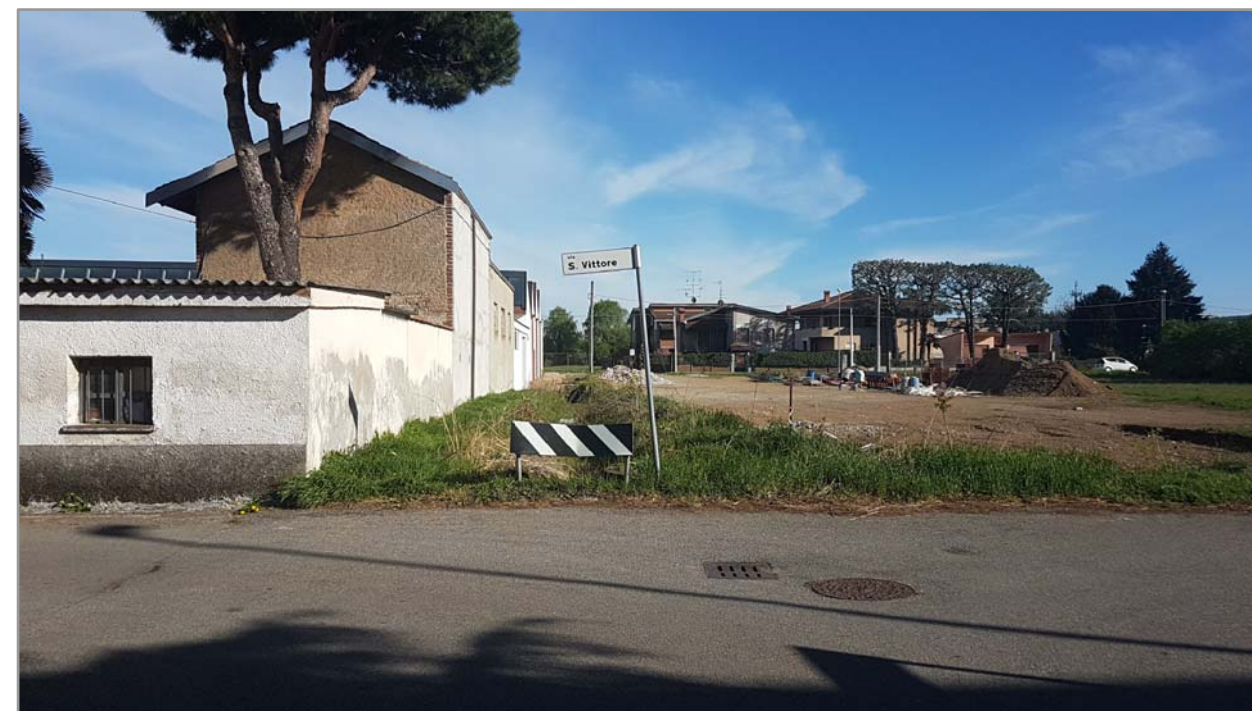
Fotografia n° 8