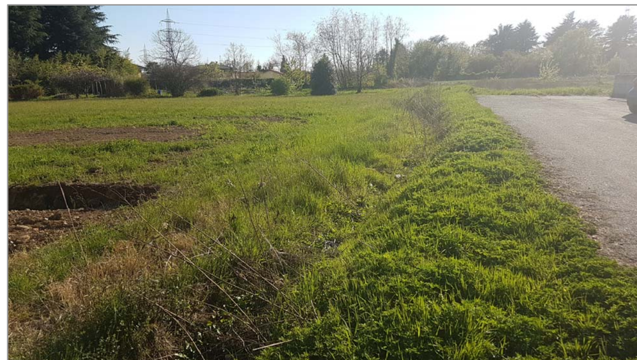
Fotografia n° 16