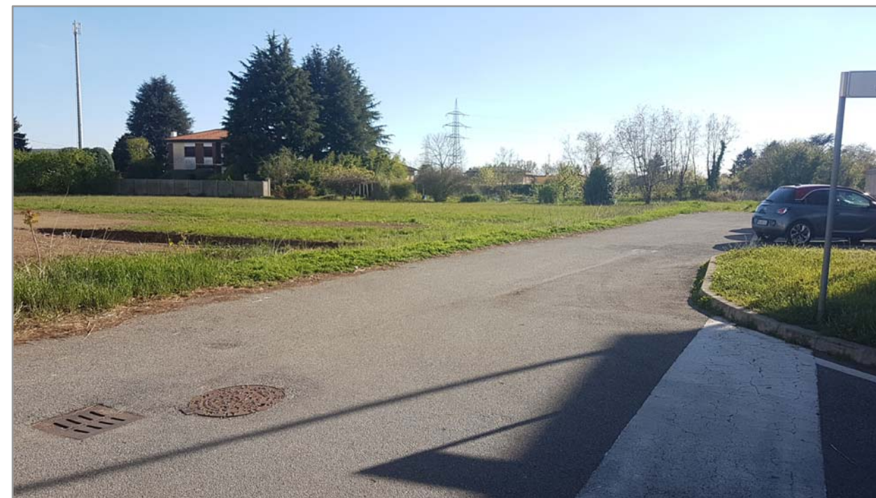
Fotografia n° 7